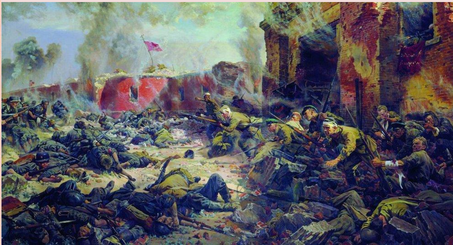
"Защитники Брестской крепости"