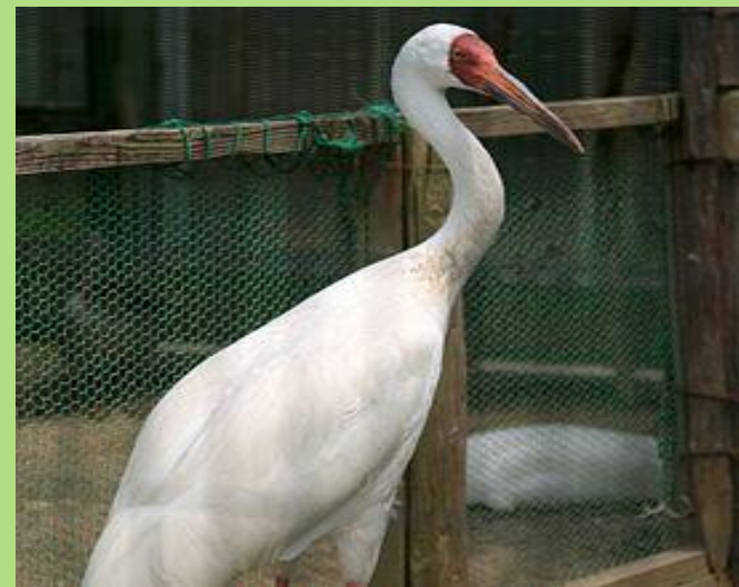
стерх или белый журавль

Все эти виды внесены в Международную Красную книгу