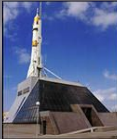
Музей «Самара космическая»