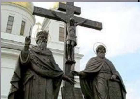
Памятник Кириллу и Мифодию