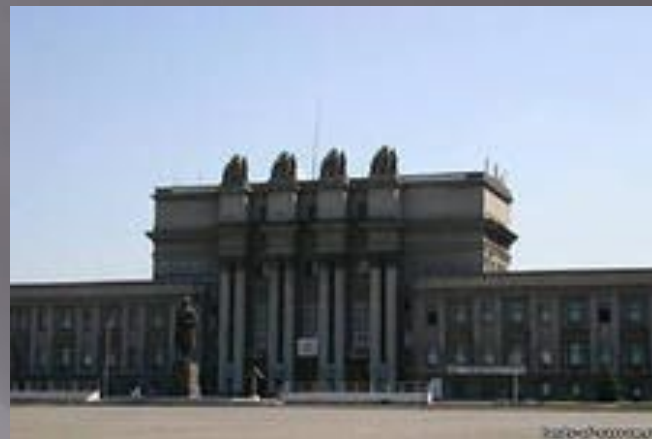
Театр оперы и балета