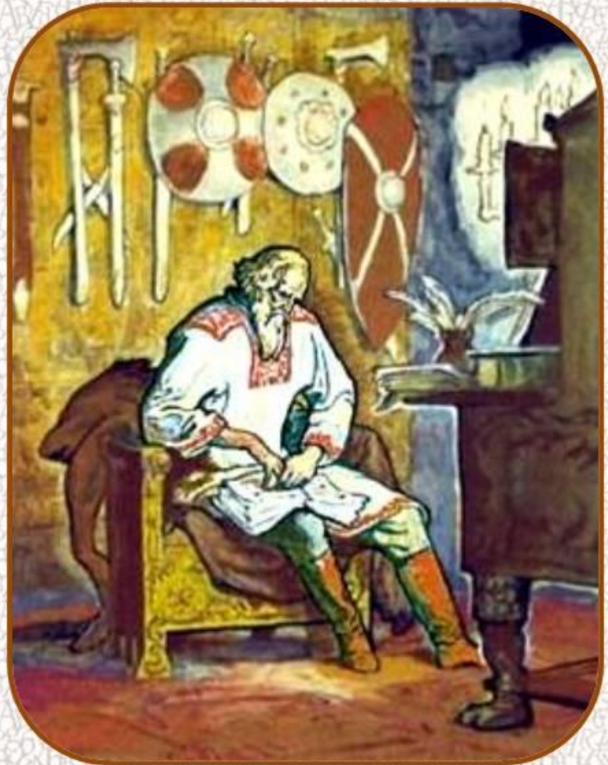
Великий князь Владимир Мономах. И. Архипов