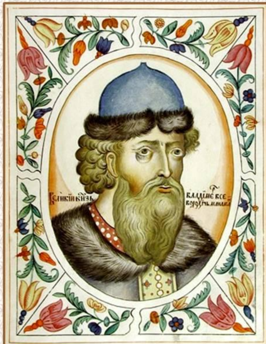
Великий князь Владимир Всеволодович Мономах. Портрет из Царского титулярника. 1672 год