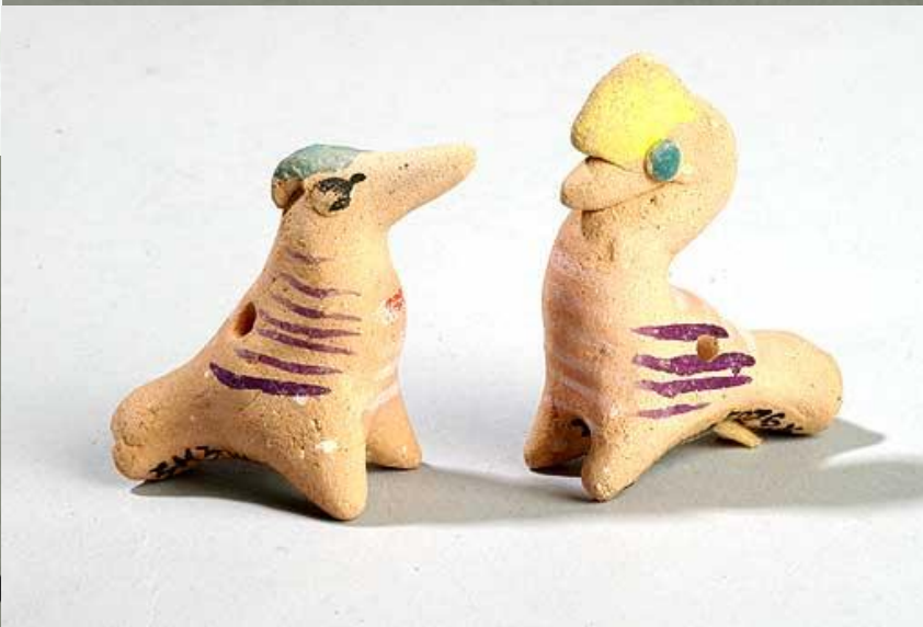
Воронежская керамика игрушка .