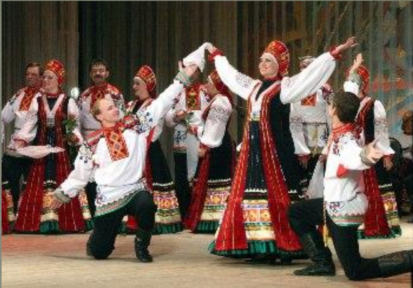
Государственный академический Воронежский русский народный хор им.К.И.Массалитинова.