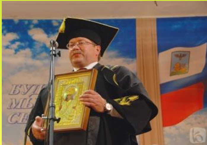
Вручение премии В.Я.Горина