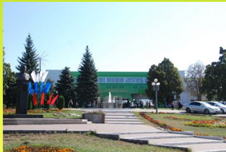
Дом культуры в Бессоновке