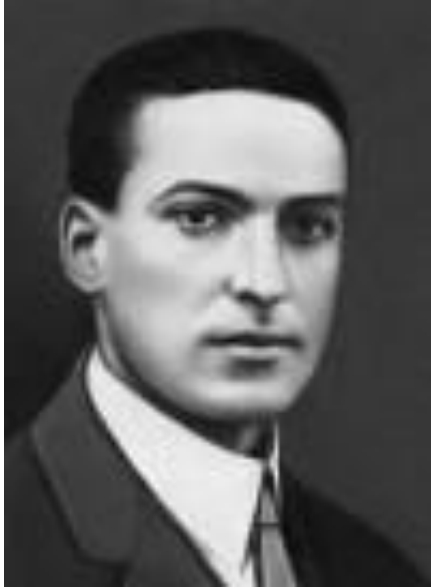
Л. С. Выготский