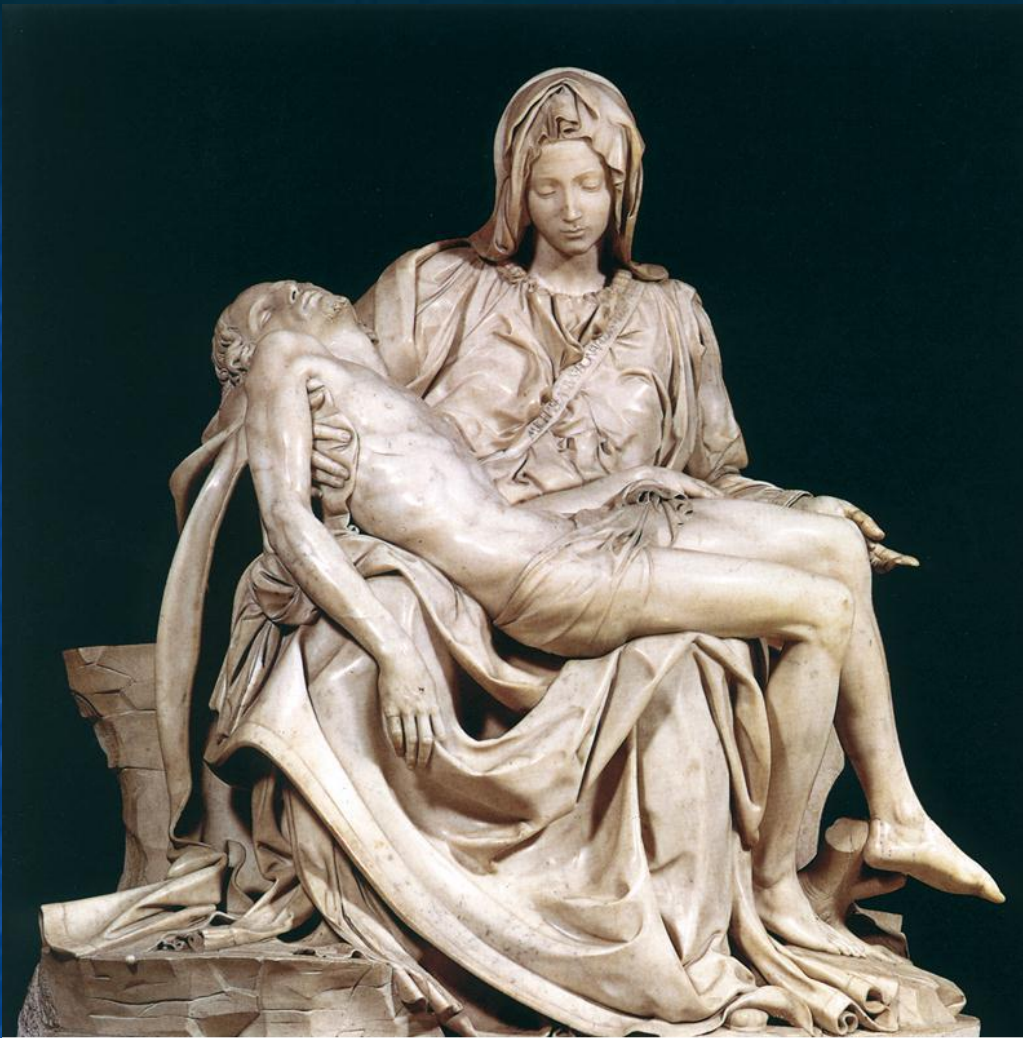
Микеланджело. «Пьета» (сцена оплакивания Христа Богоматерью). 1498—1499. Рим. Собор Святого Петра