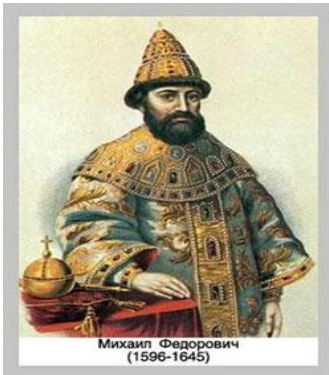
Михаил Федорович (1596-1645)