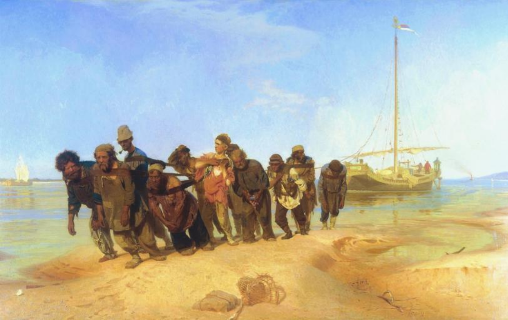
И.РЕПИН. БУРЛАКИ НА ВОЛГЕ