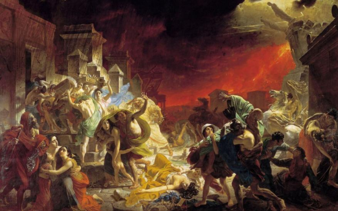
К.БРЮЛЛОВ ПОСЛЕДНИЙ ДЕНЬ ПОМПЕИ