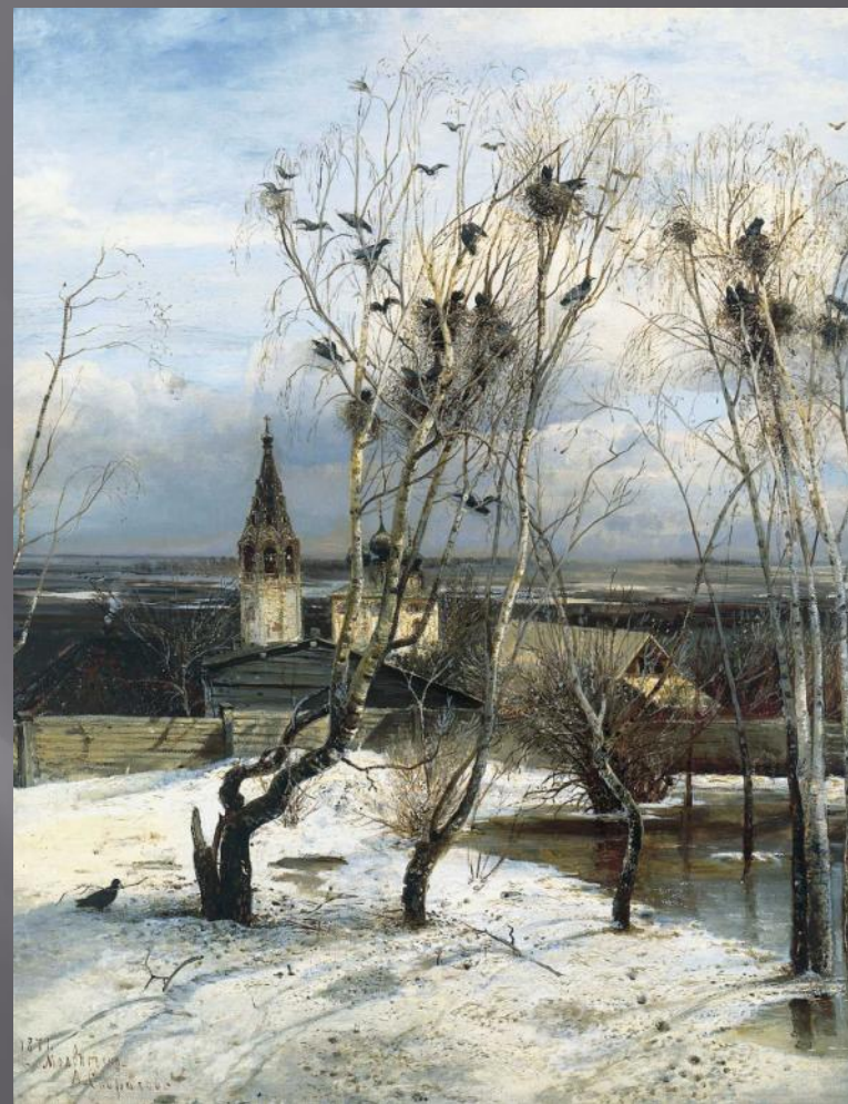
А САВРАСОВ ГРАЧИ ПРИЛЕТЕЛИ