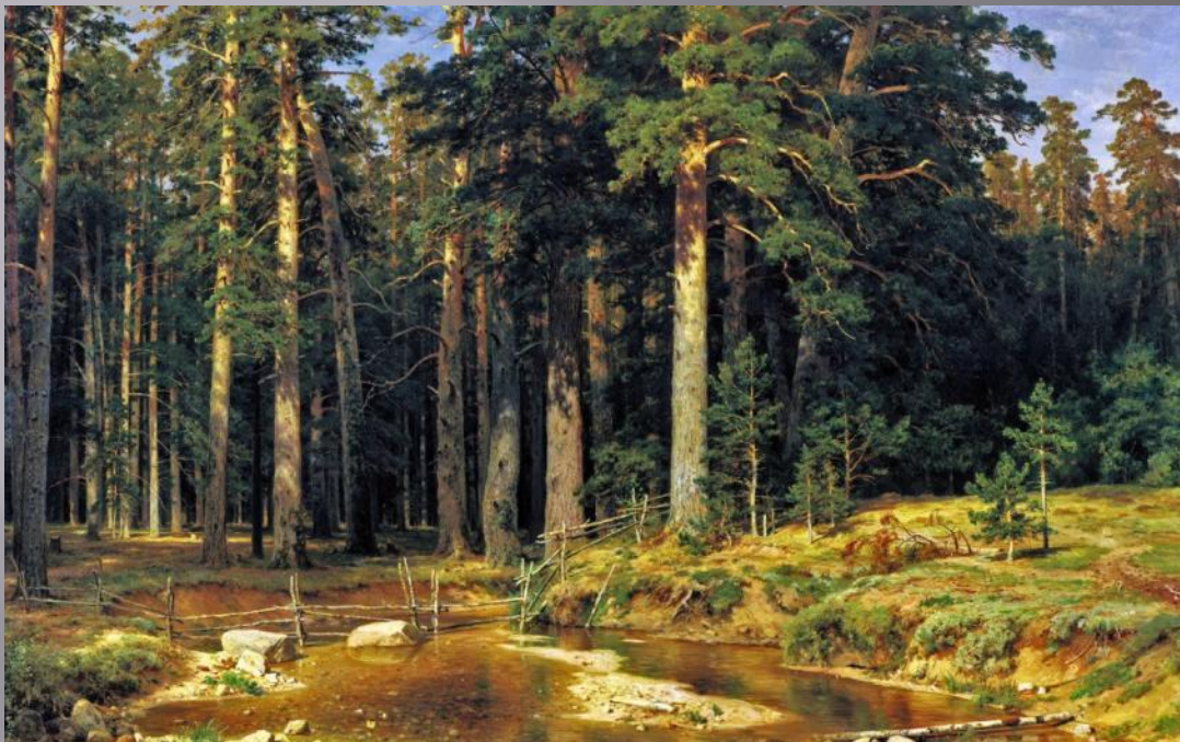
И. ШИШКИН. КОРАБЕЛЬНАЯ РОЩА