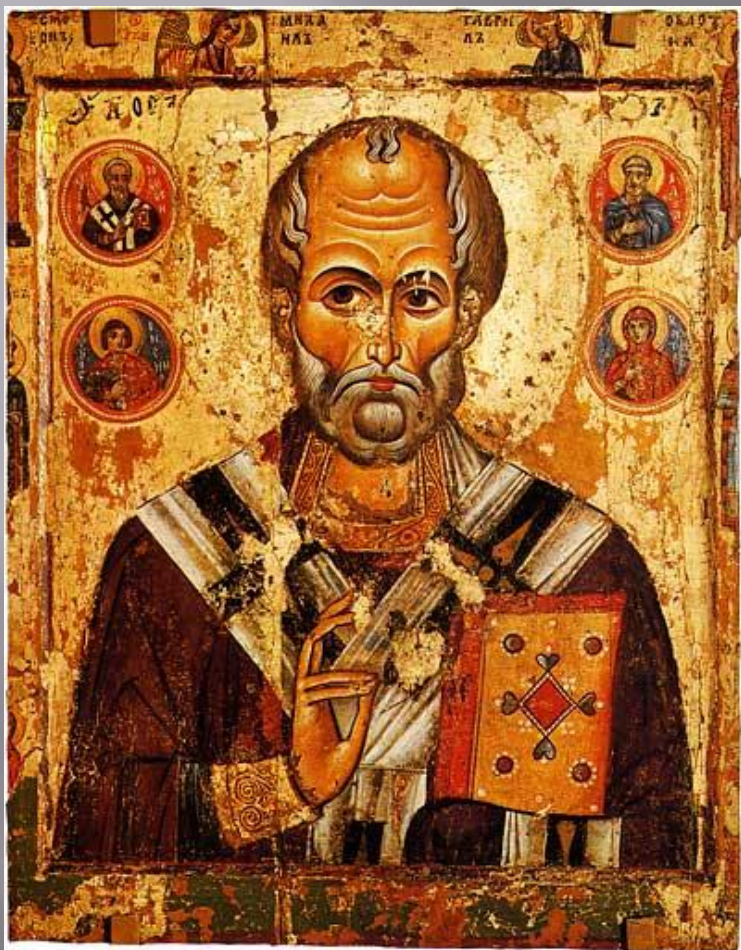
Николай Чудотворец XIII век.

В древнерусском отделе широко представлены иконы XII—XV веков: произведения Андрея Рублёва, Дионисия, Симона Ушакова и других мастеров.