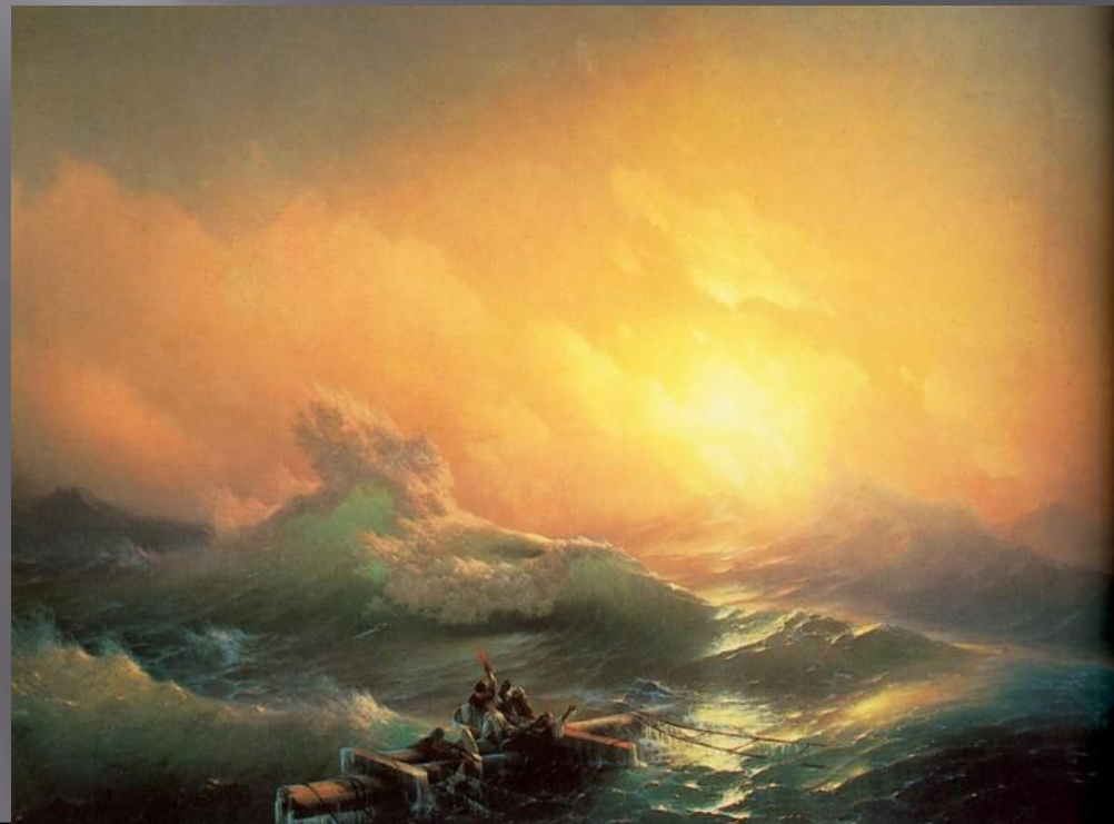
И. АЙВАЗОВСКИЙ ДЕВЯТЫЙ ВАЛ