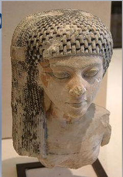
Дочь Нефертити (18 династия Египта)

Скульптура — вырезаю, высекаю — ваяние, пластика — вид изобразительного искусства, произведения которого имеют объёмную форму и выполняются из твёрдых или пластических материалов — в широком значении слова, искусство создавать из глины, воска, камня, металла, дерева, кости и других материалов изображение человека, животных и иных предметов природы в осязательных, телесных их формах