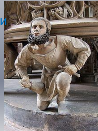
Скульптура из церкви святого Лоренцо