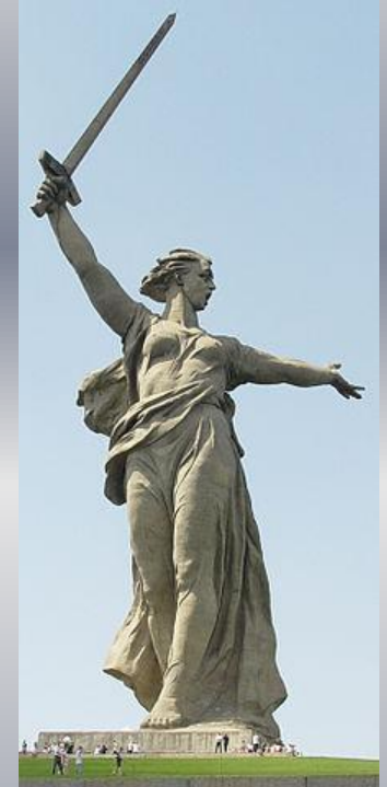
Бетонная скульптура Родина-мать