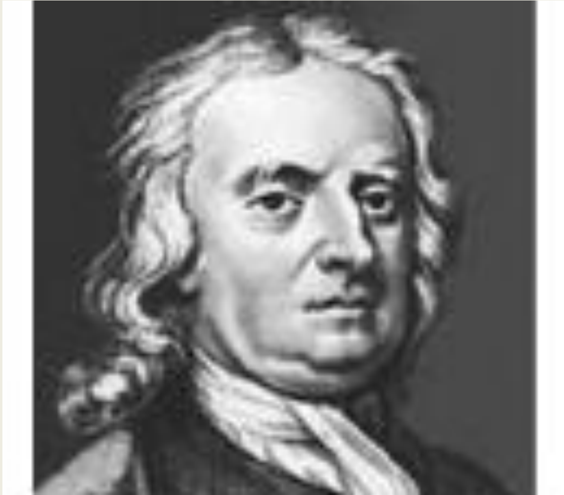
И. Ньютон (1642 - 1727)