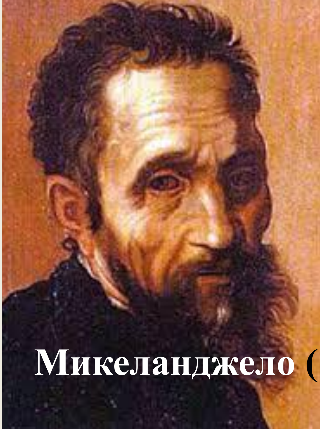
Микеланджело (1475 - 1564)