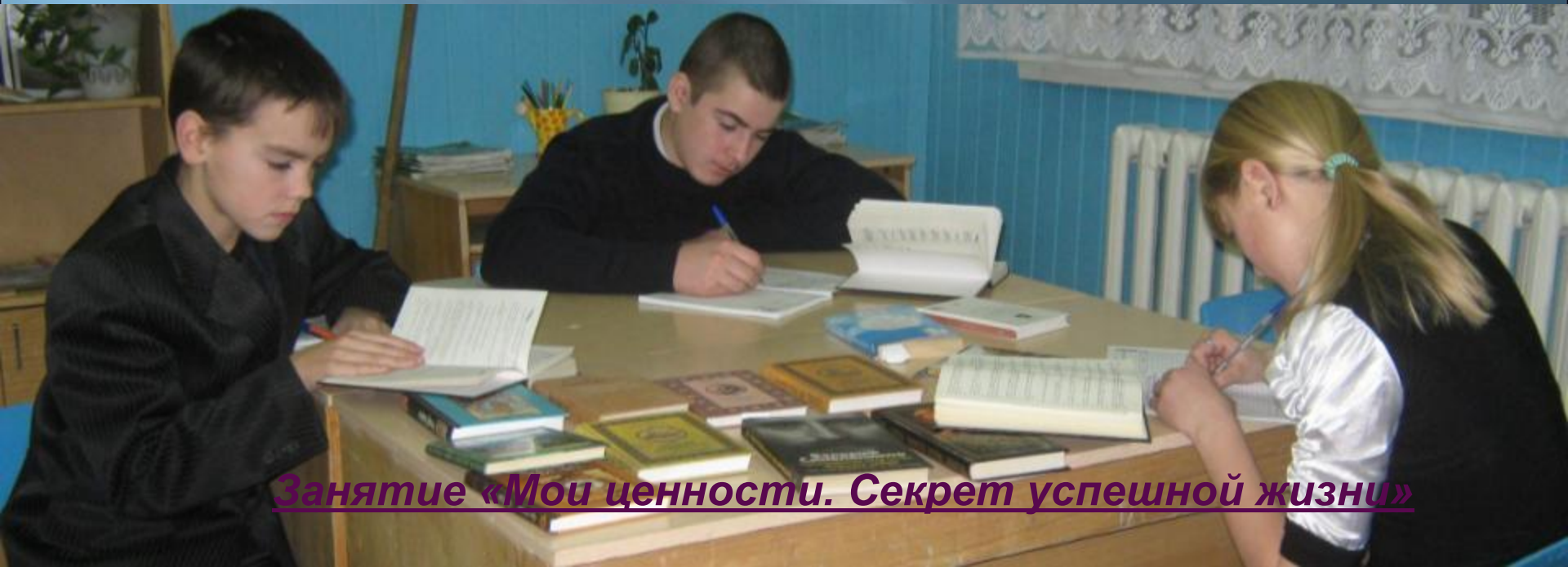
Занятие «Мои ценности. Секрет успешной жизни»