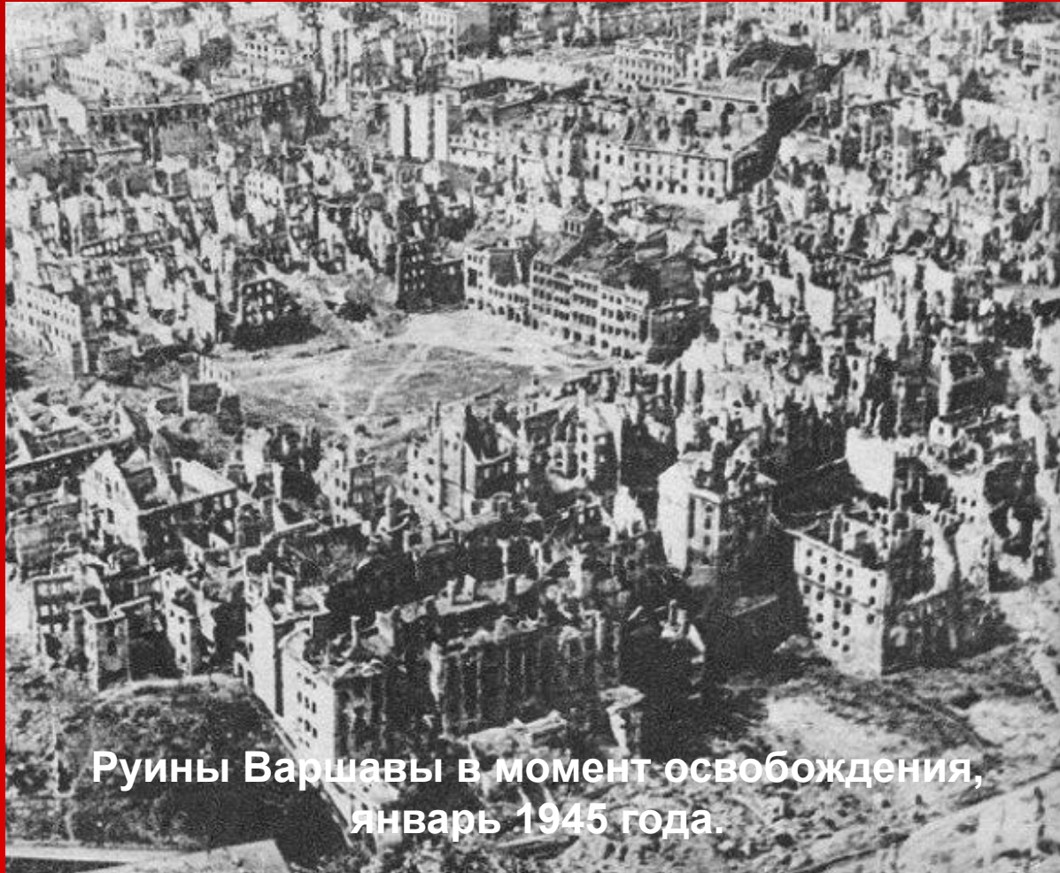
Руины Варшавы в момент освобождения, январь 1945 года.

Варшава была освобождена от немецких войск 17 января 1945 г. войсками 1-го Белорусского фронта и 1-й армией Войска Польского.