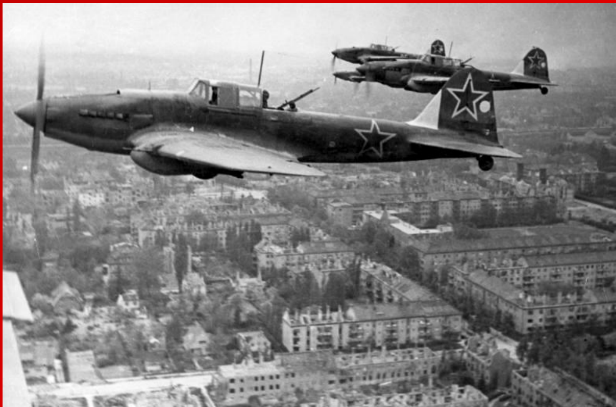
Ил-2 над Берлином, 1945.

Потеряв Берлин, фашистская Германия не могла продолжать вооружённое сопротивление. 8 мая 1945 года представители немецкого главнокомандования подписали акт о полной и безоговорочной капитуляции.