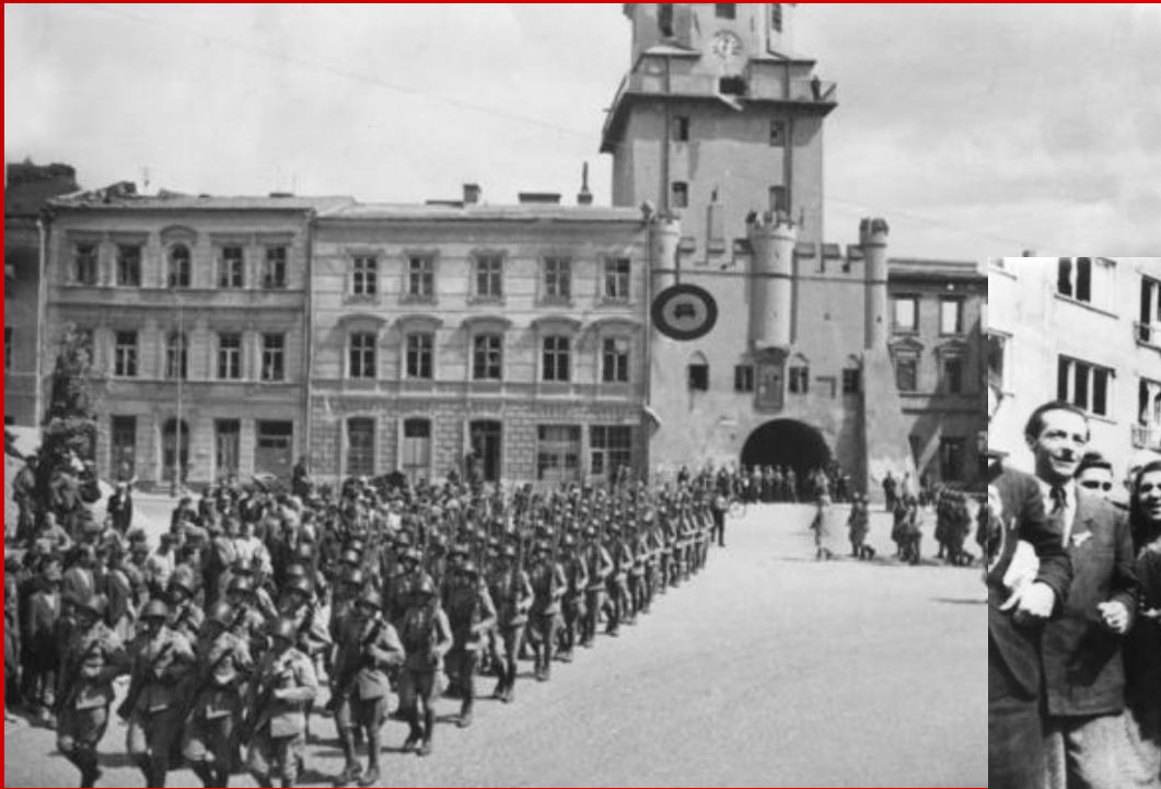
Советские воины в освобожденном Люблине. Польша, 1944 г.

24 июля 1944 г. Люблин был освобожден от немцев советскими войсками. До января 1945 г. являлся временной столицей Польши.