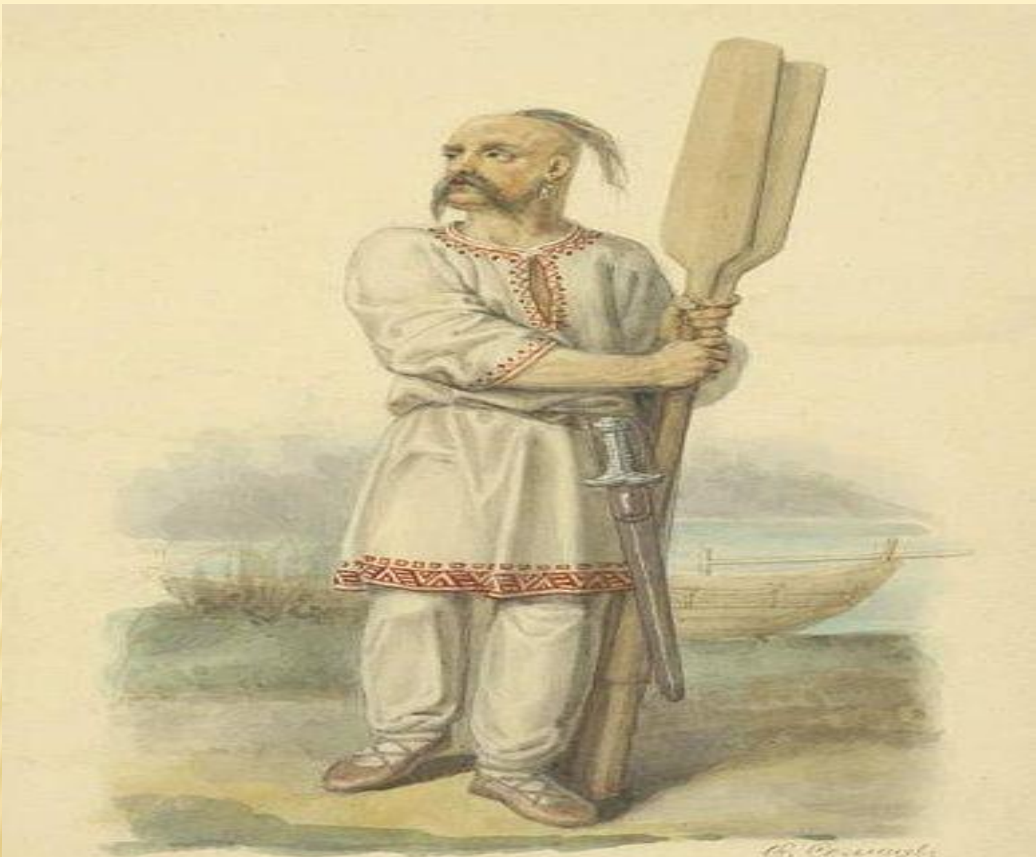
В. С. Савицкий Б:К: СВЯТОСЛАВЪ ИГОРЕВИЧЪ СКОНЧ: 972 Г. (ПО ОПИСАНІЮ) АВВА ДІАКОНА.