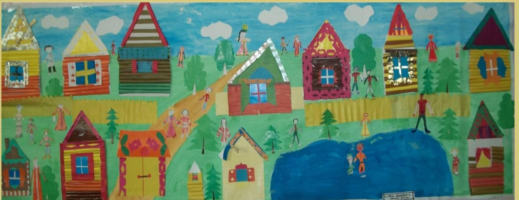
Проект «Моя деревня» Коллективная работа 4а класса