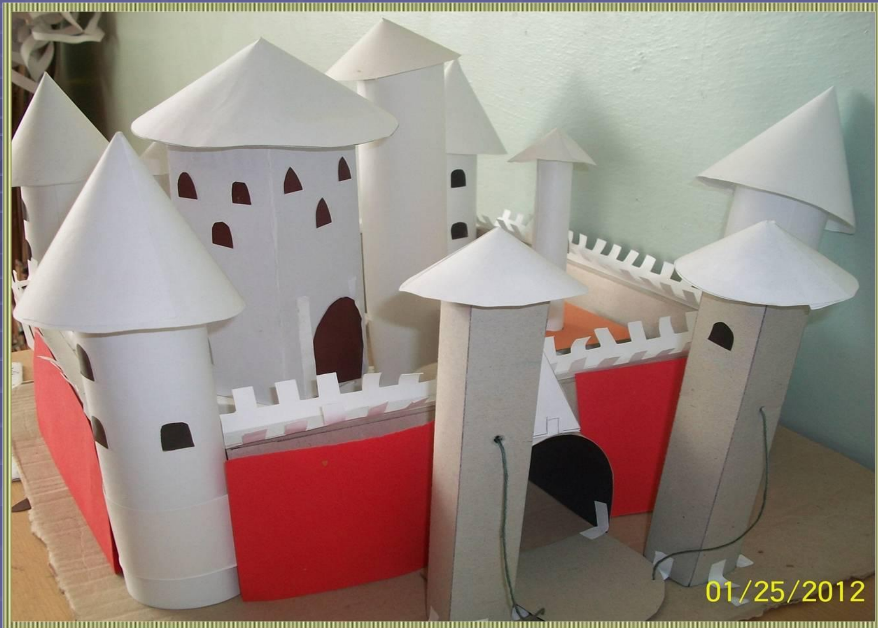
Проект «Макет средневекового замка» 8а кл.