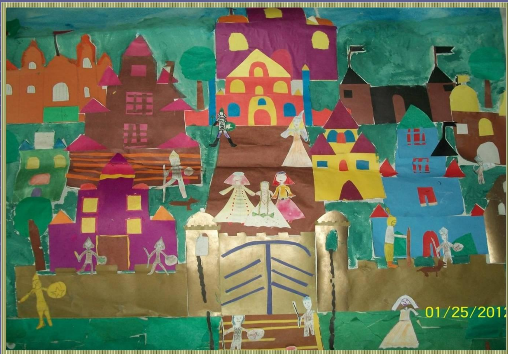
Проект «Город- крепость» 4а кл.