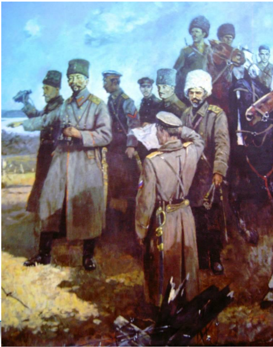
Командир 1-й пехотной бригады Добровольческой армии.