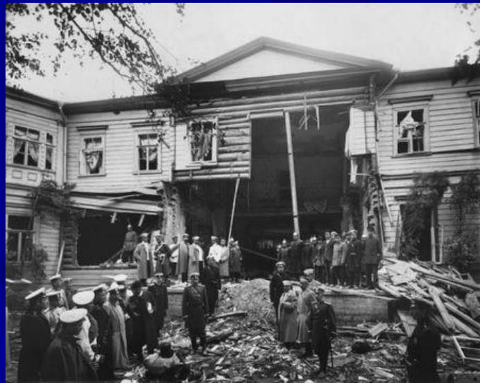
Дача Столыпина после взрыва.