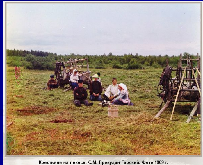
Крестьяне на покосе. С.М. Прокудин-Горский. Фото 1909 г.