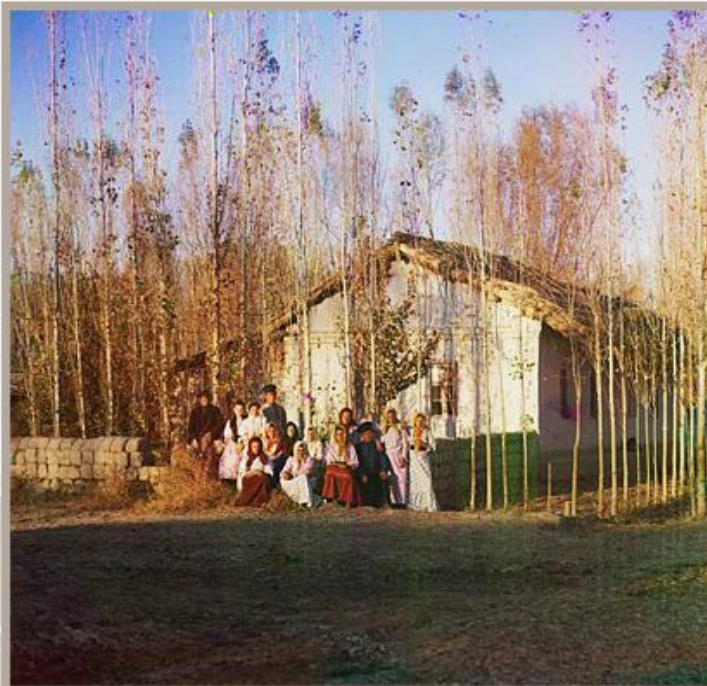
Крестьяне-переселенцы. С.М. Прокудин-Горский. Фото 1910-х гг.

Случаи обратного возвращения переселенцев из Сибири на родину, хотя и были, не в незначительном количестве».