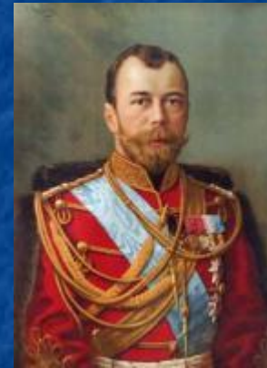
Николай II 17 октября 1905 г.