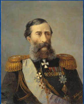
М. Т. Лорис – Меликов 1881 г.