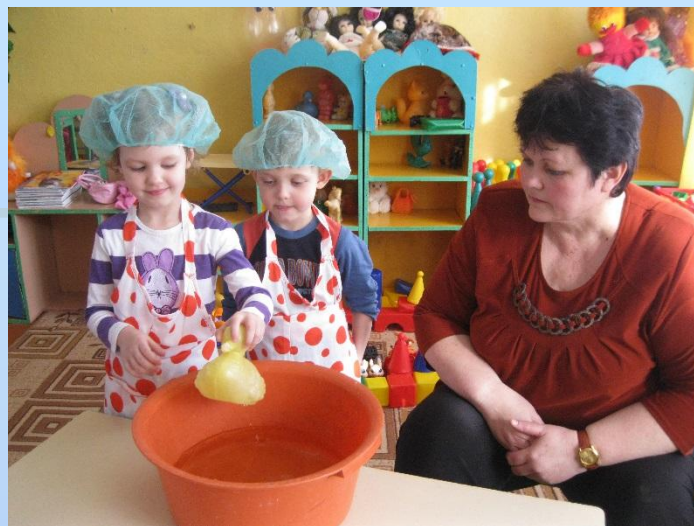
Эксперимент с камнем