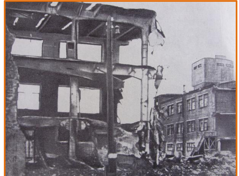
Завод им. Ленина после бомбежки

В течение 1941 – 1943 годов на Горький было совершено 43 вражеских налета, в которых участвовало около 650 немецких самолётов. На город было сброшено 1560 фугасных и 4787 зажигательных бомб.