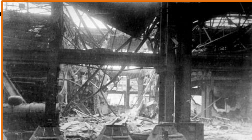
ГАЗ после налета фашистской