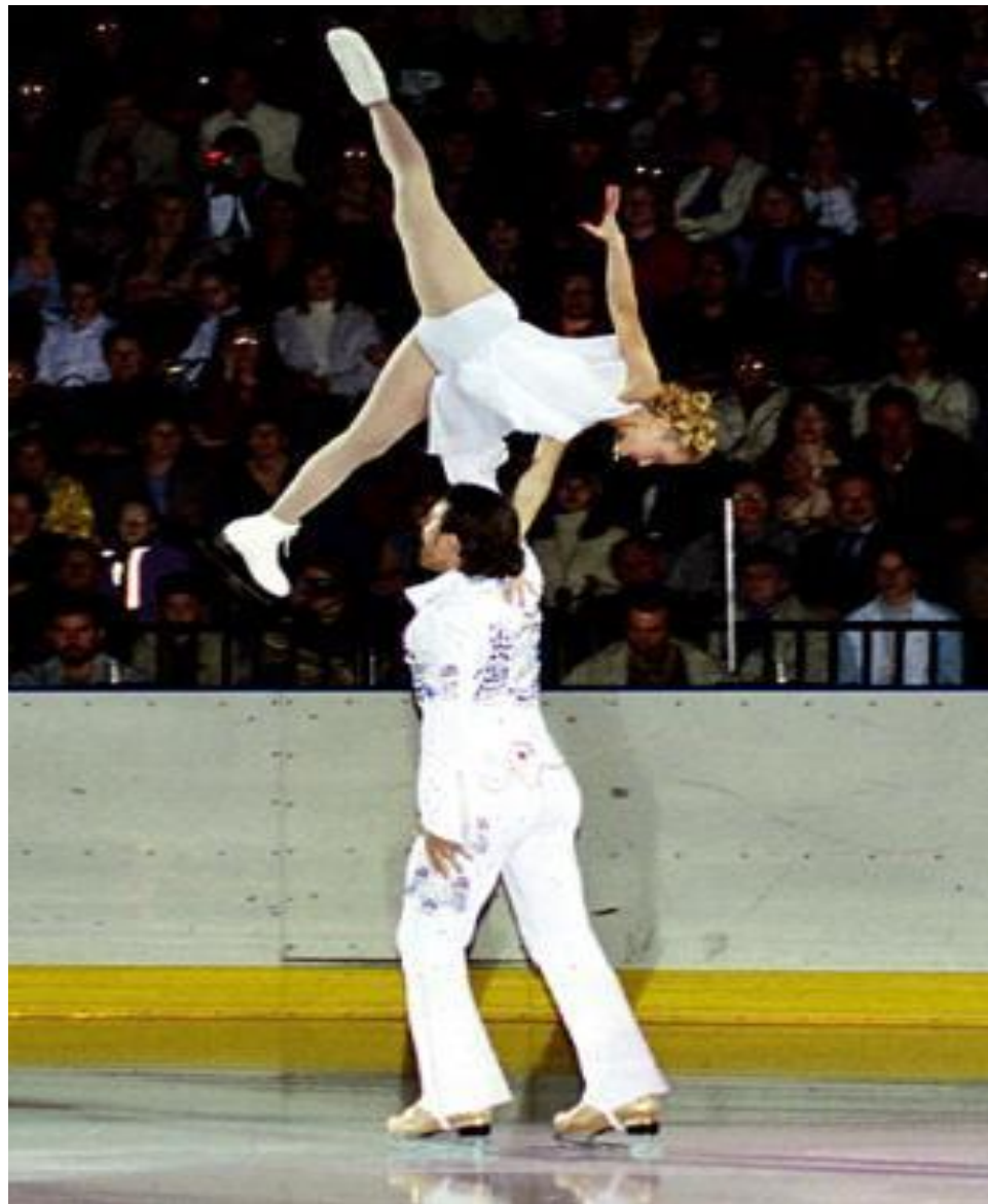
ФИГУРНОЕ КАТАНИЕ парное