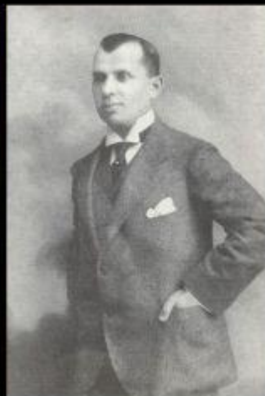
Леонид Александрович Сенько-Поповский, Черноморский вице- губернатор, основатель музея.

Музей в Новороссийске был создан в 1916 году по инициативе Черноморского вице-губернатора Л.А. Сенько-Поповского, как Музей Природы и Истории Черно-морского Побережья Кавказа. В основу его фондов легли предметы старины, хранившиеся в городской публичной библиотеке с 1894 г. и коллекции по палеонтологии и геологии первого хранителя музея Г.Н. Сорохтина.