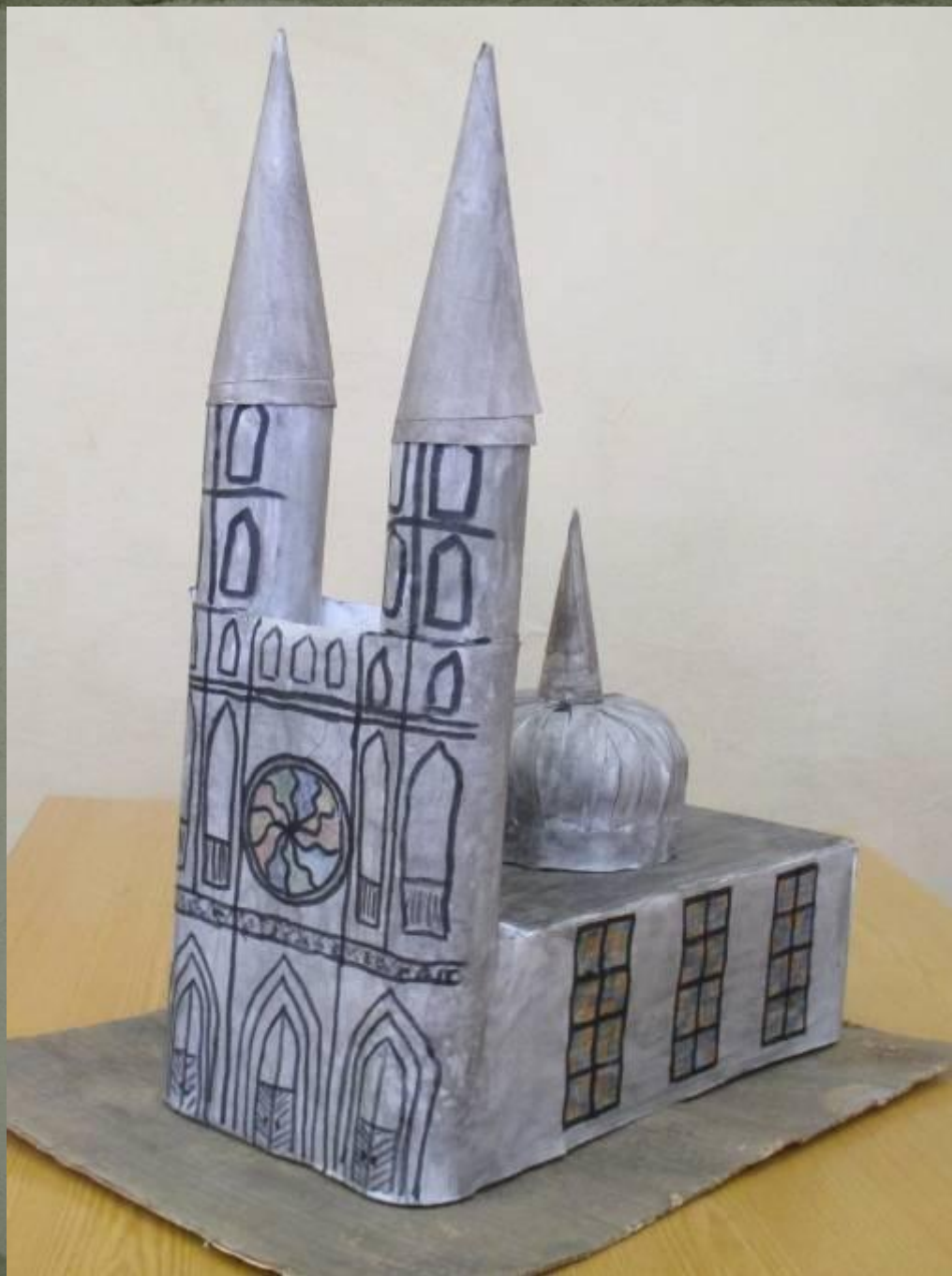
Макет ГОТИЧЕСКОГО СОБОРА