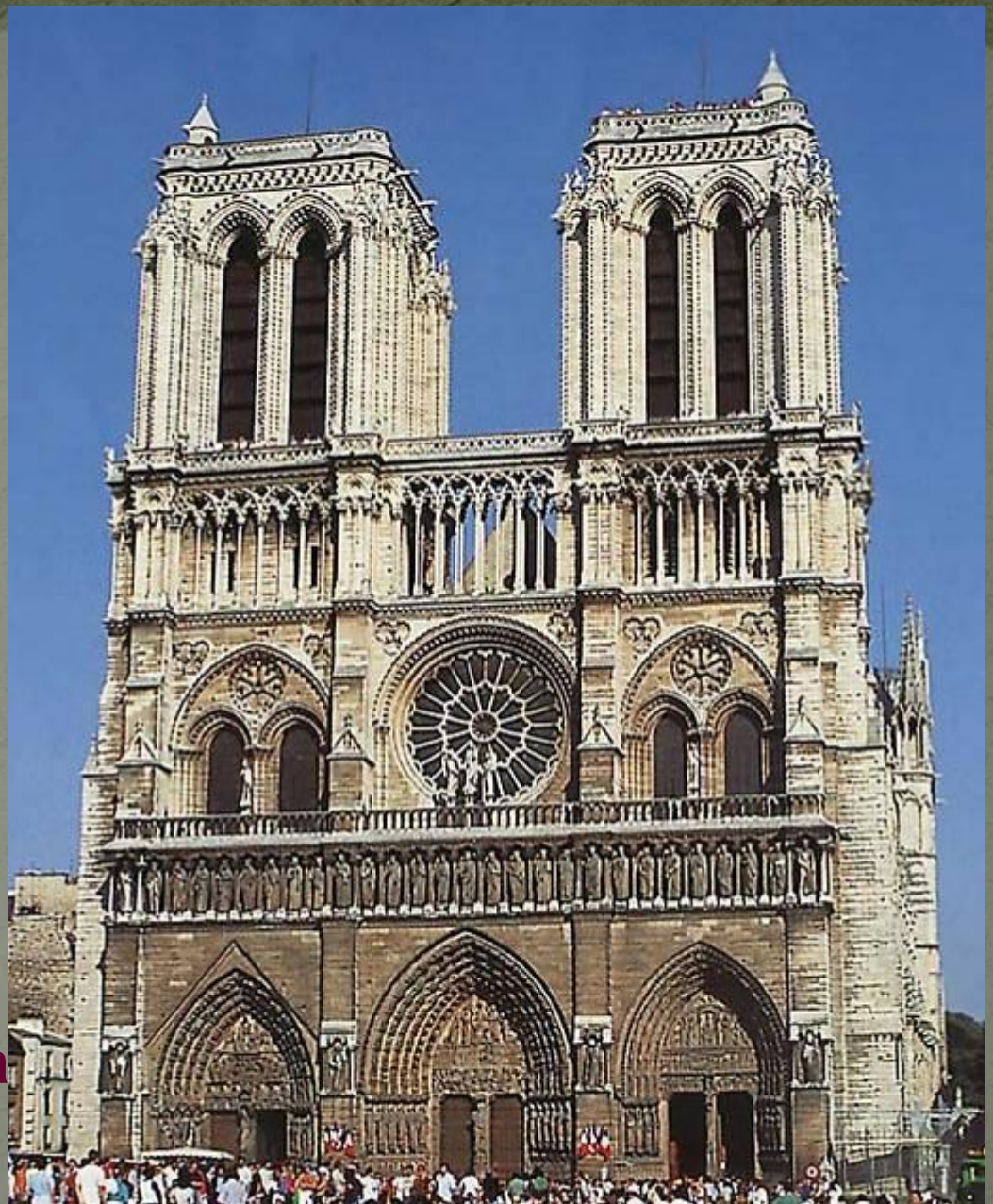
Собор Парижской Богоматери