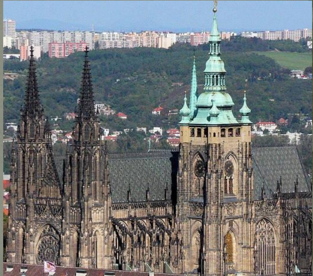
Собор Св. Вита, Прага