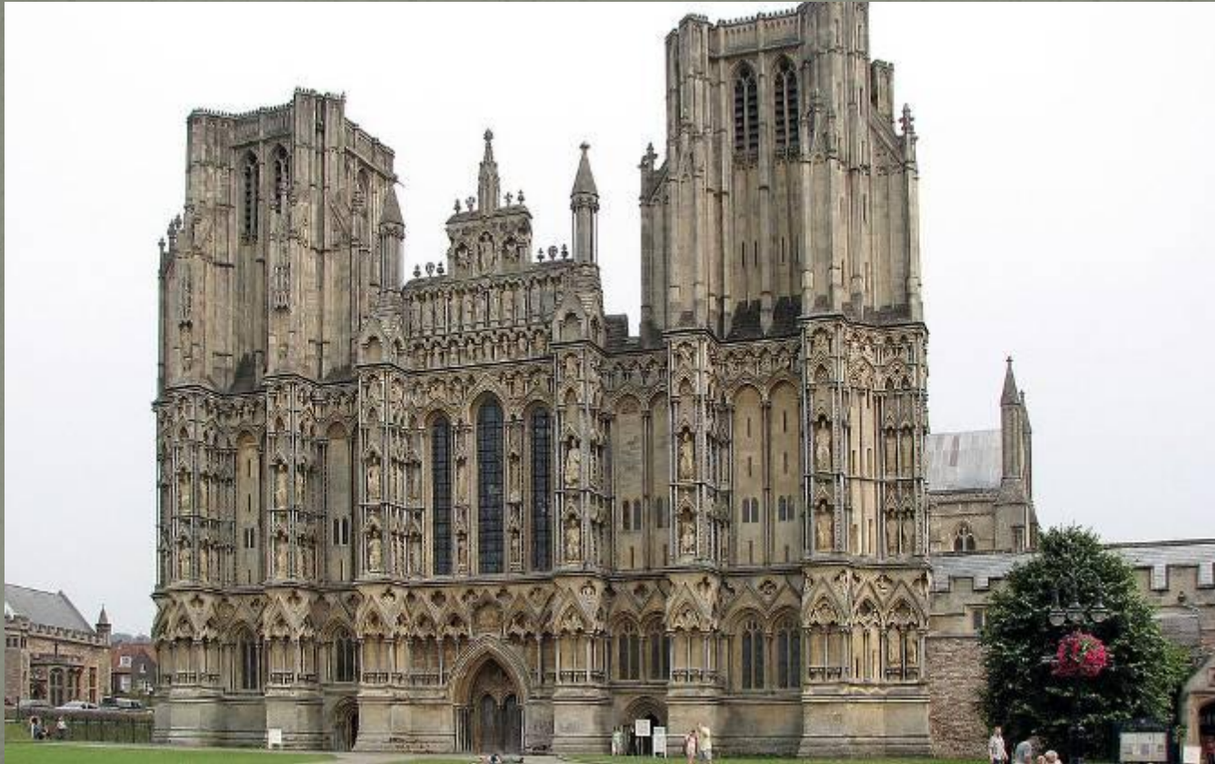
Собор в Уэлсе

Готическая архитектура — период развития западно- и центральноевропейской архитектуры, соответствующий зрелому и позднему Средневековью (с конца XII по начало XVI века). Готическая архитектура сменила архитектуру романской эпохи и в свою очередь уступила место архитектуре периода Возрождения.