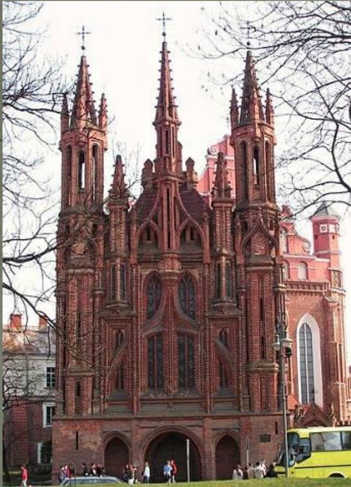
Костел Св. Анны, Вильнюс

Готика зародилась в северной части Франции в середине XII века и достигла расцвета в первой половине XIII в., распространившись по всей Европе.