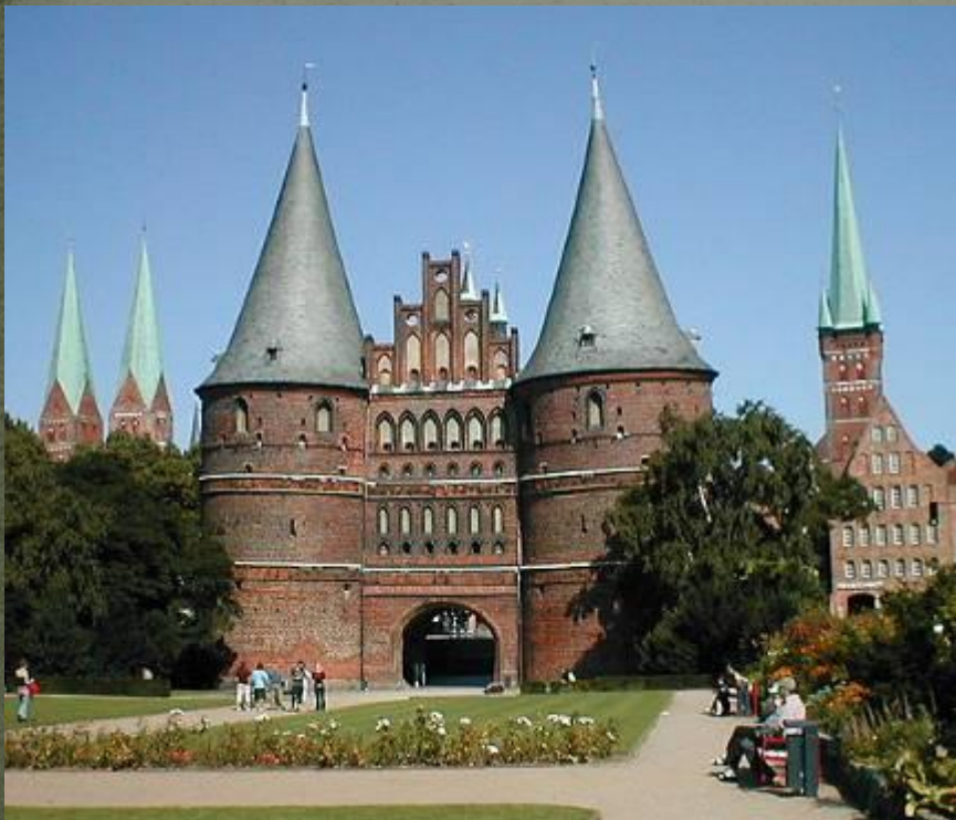
Голштинские ворота, Германия

Образ средневекового города предстает как мир самых разных построек: соборов, ратуш, цехов и каменных жилых домов с остроконечными крышами.