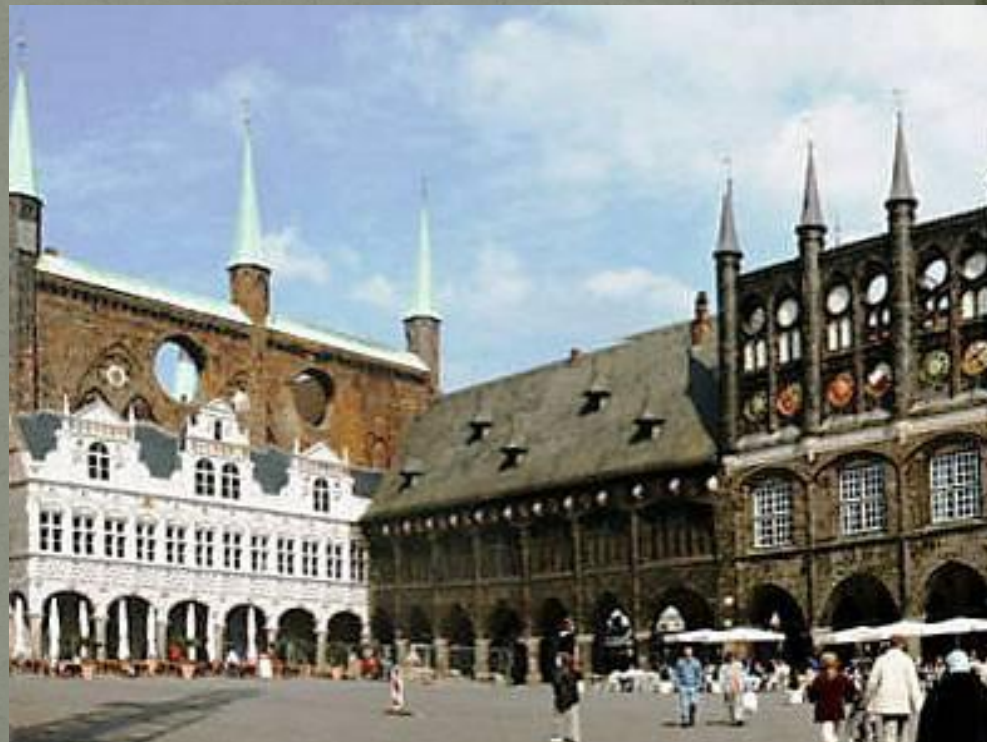
Мерия Любека, Германия