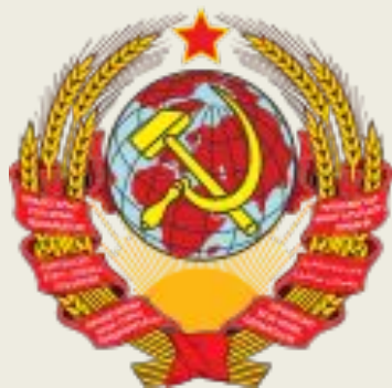
Окончательный вариант герба СССР от 6 июля 1923 года