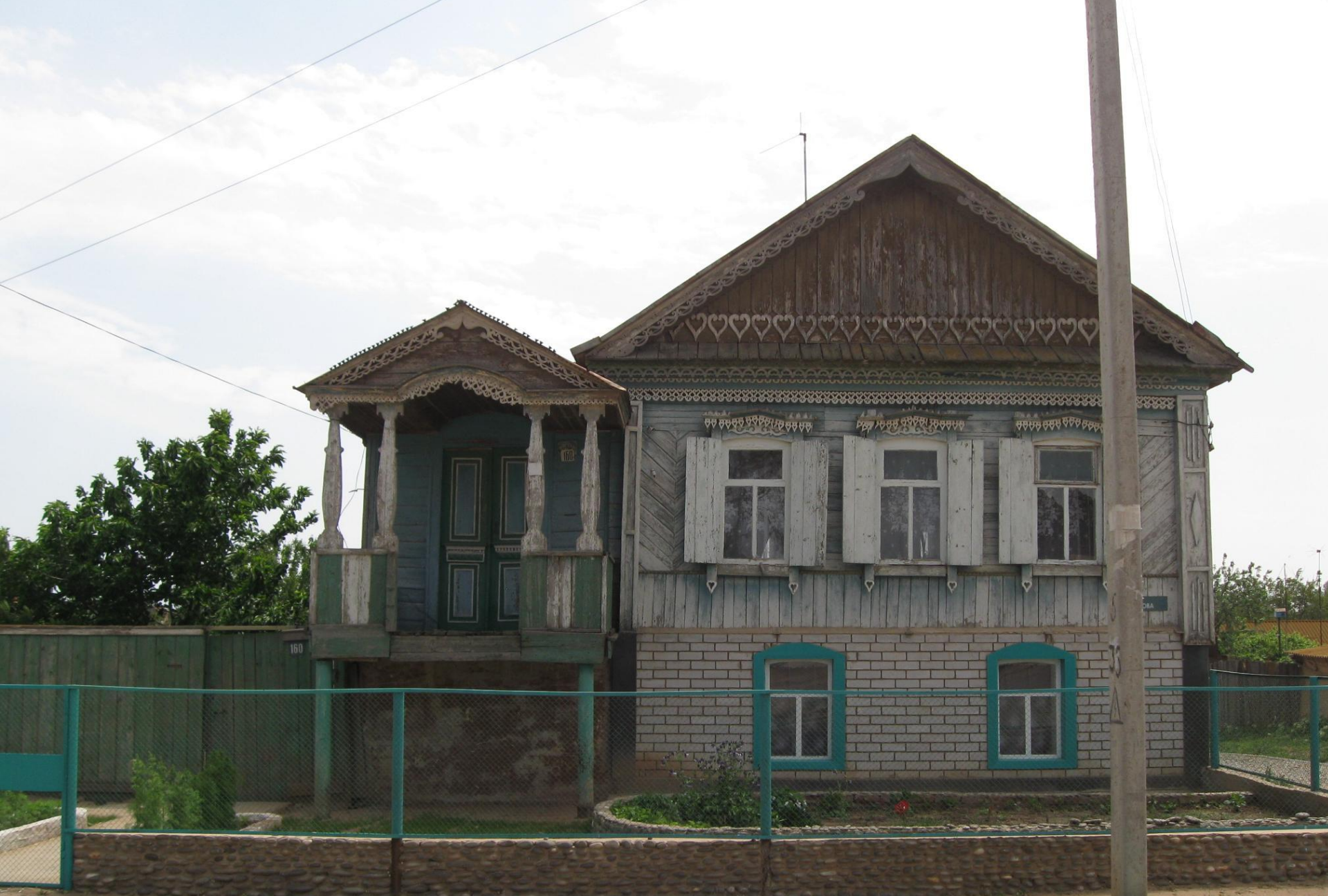
Старинный купеческий дом середины XIX века.