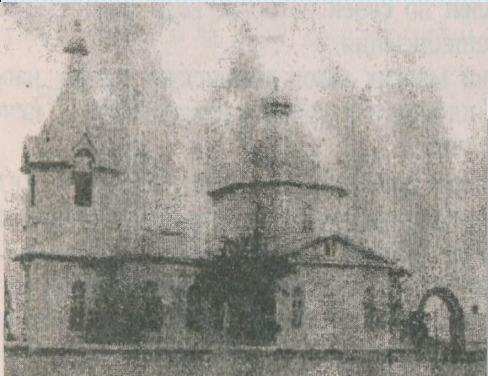
Село Яндыки. Храм Св. Николая. Внешний вид. Дореволюционное фото

В 1861 году была построена церковь во имя Святителя Николая Чудотворца.