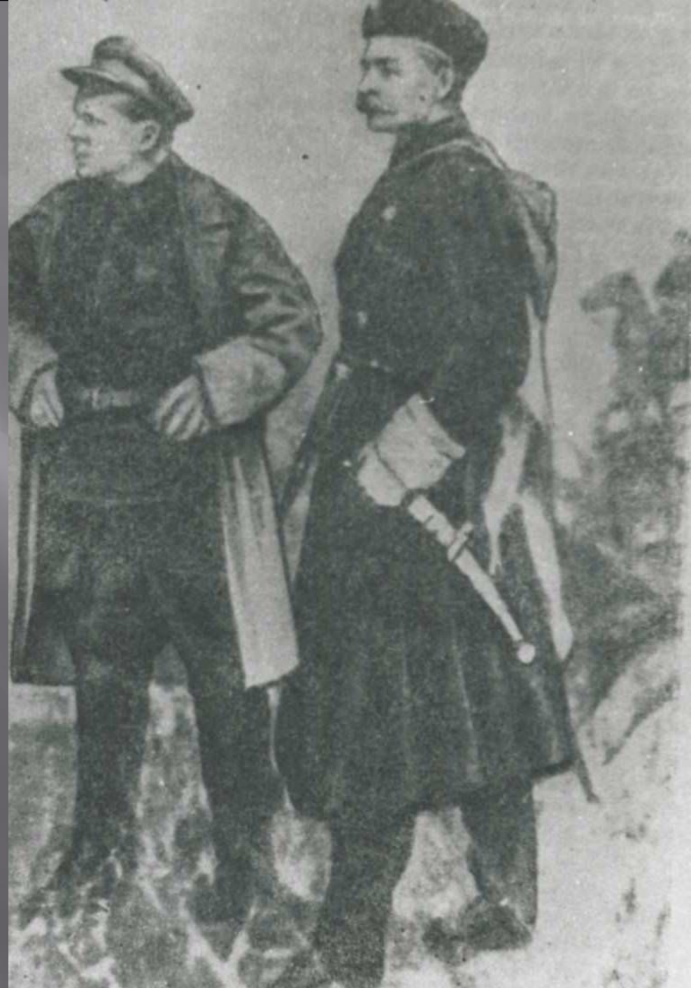
С.М. Киров под Яндыками