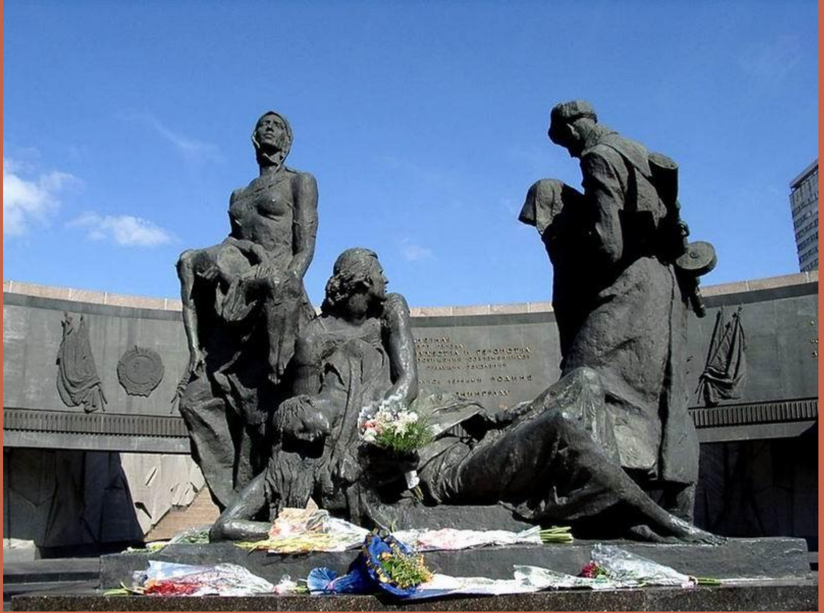
Мемориал защитникам Ленинграда