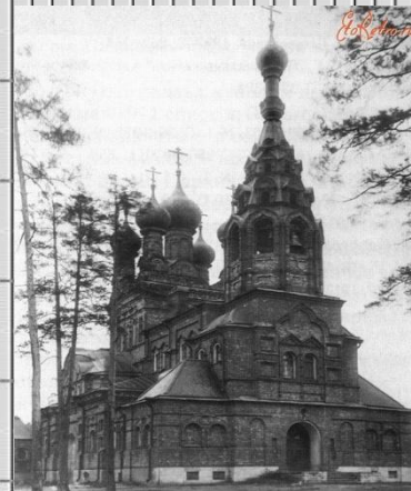
Храм Тихвинско й иконы Божией матери