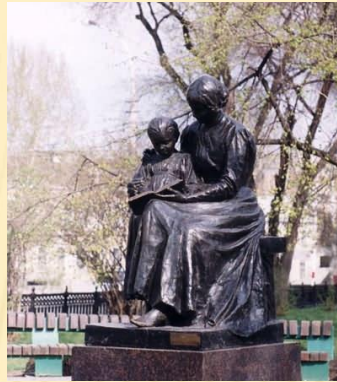
Памятник первой учительнице