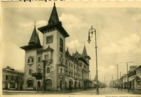
Саратовская консерватория им. Л.В. Собинова