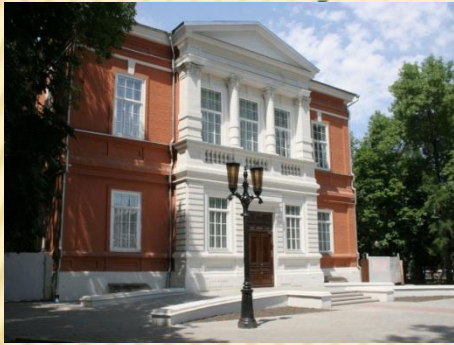
Музей им.А.Н. Радищева