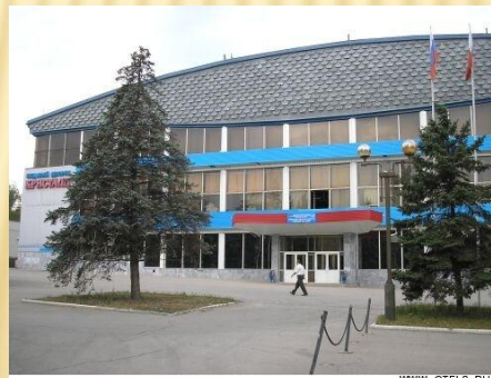
Дворец спорта «Кристалл»