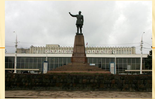
Привокзальная площадь. Памятник Ф.Э Дзержинскому