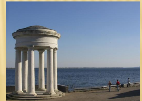
Ротонда на Волге