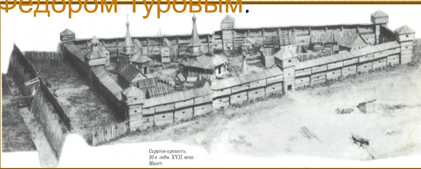
Саратов-крепость. 30-е годы XVII века. Макет.

Город Саратов основан в 1590 году князем Григорием Засекиным и боярином Фёдором Туровым.