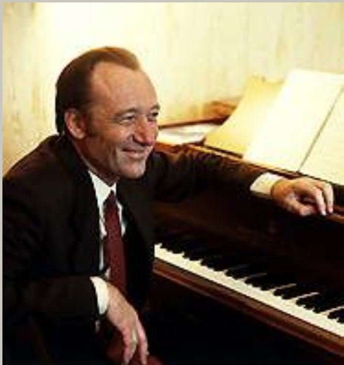
ЩЕДРИН Родион Константинович