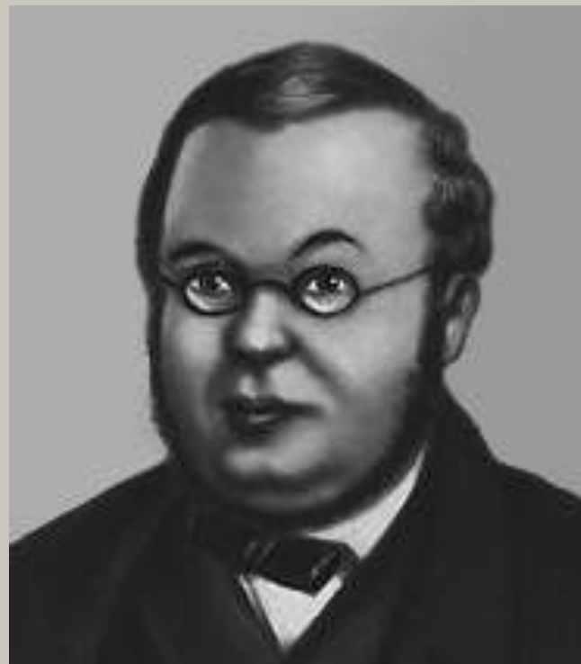
ЕРШОВ Петр Павлович