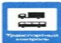
7.14 Пункт контроля международных автомобильных перевозок