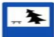
7.11 Место отдыха