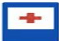
7.1 Пункт первой медицинской помощи