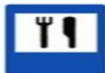
7.7 Пункт питания