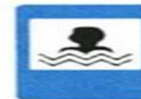
7.17 Бассейн или пляж