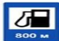
7.3 Автозаправочная станция