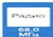
7.15 Зона приема радиостанции, передающей информацию о дорожном