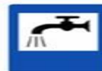
7.8 Питьевая вода