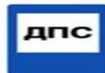
7.12 Пост дорожно-патрульной службы