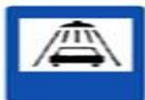
7.5 Мойка автомобилей