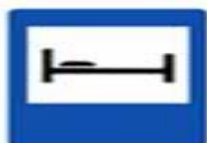
7.9 Гостиница или мотель