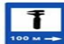
7.4 Техническое обслуживание автомобилей