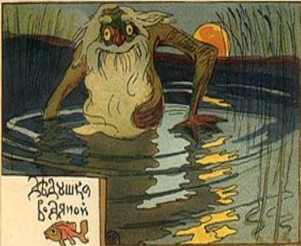
водяной с открытки (рисунок Владиминова В.В.)

Водяной (водящий) сидит в кругу с закрытыми глазами. Играющие водят вокруг него хоровод со словами: