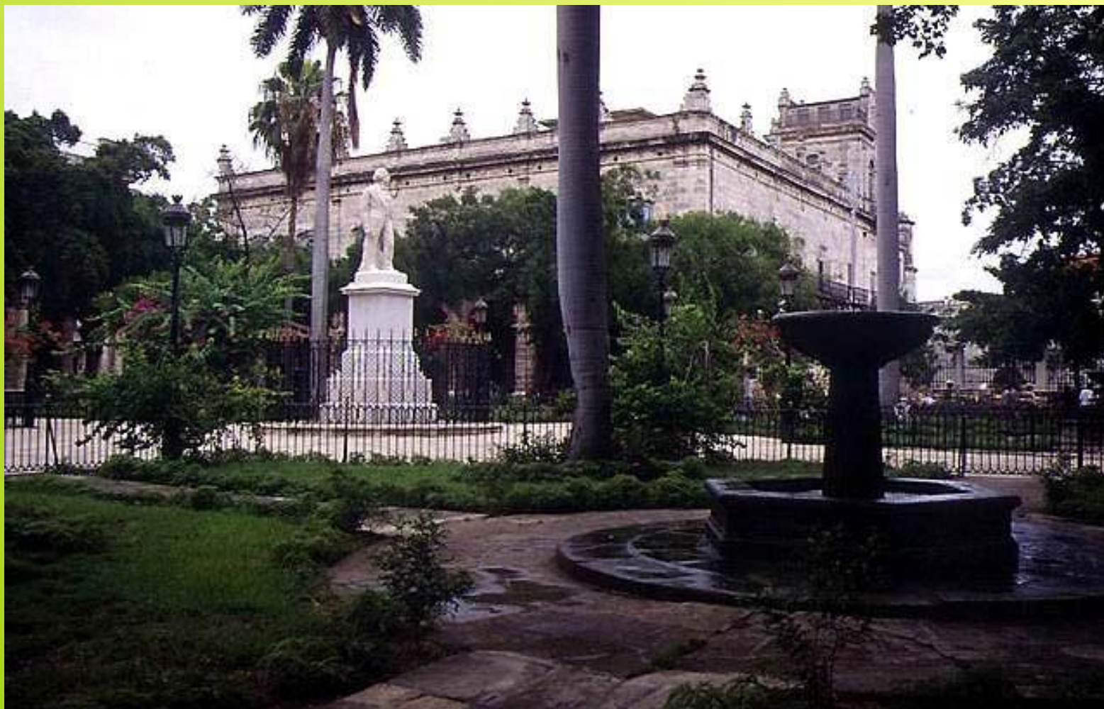
Гавана. Плаза де Армаз.