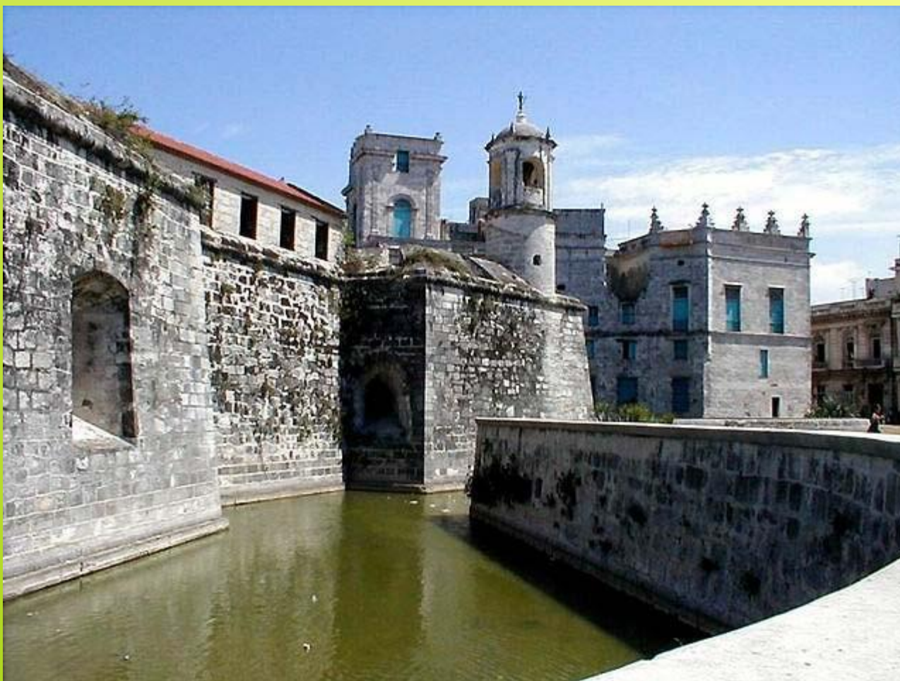
Ла Реаль Фуэрса. Гавана.