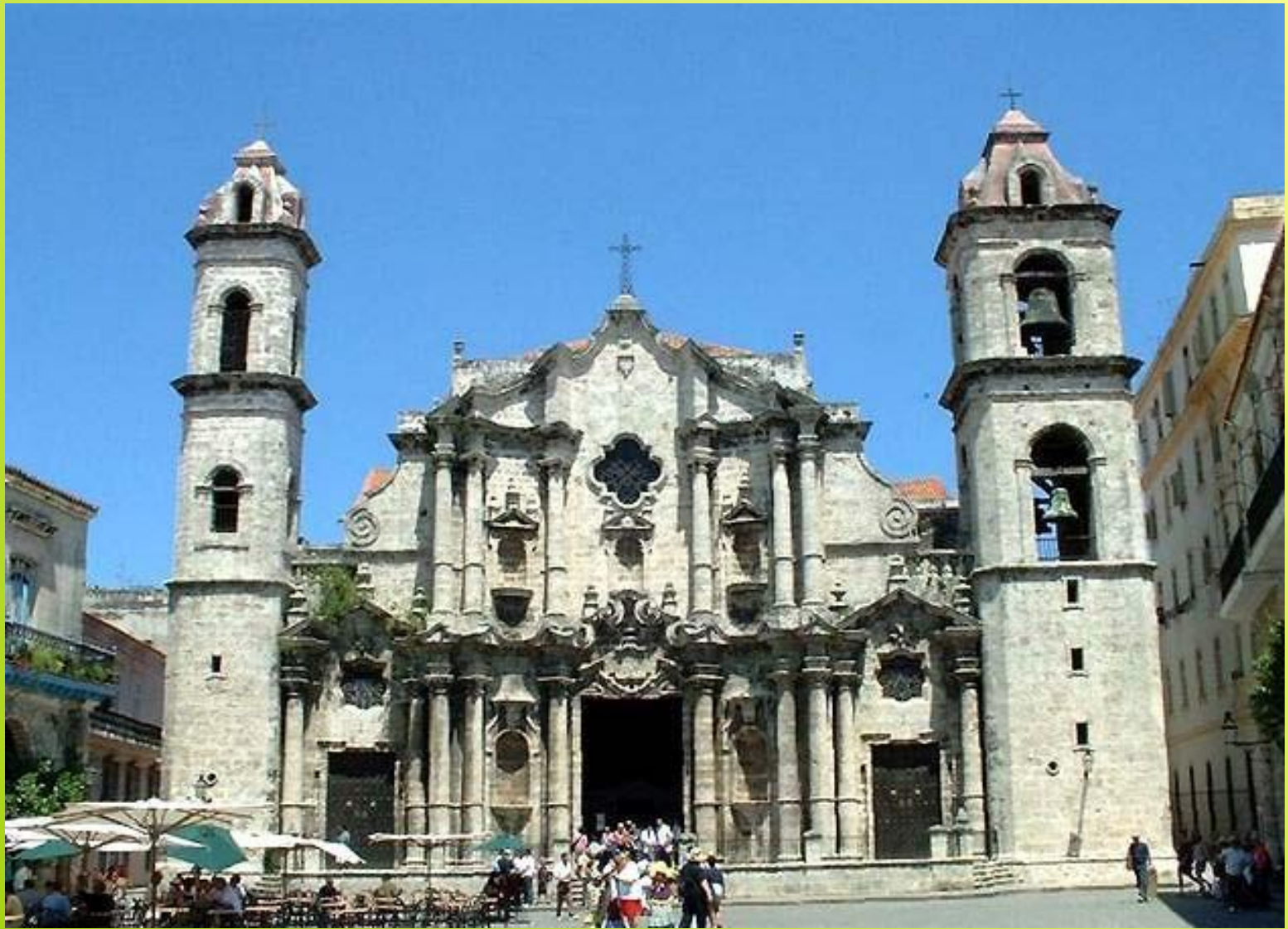
Гавана. Собор святого Христофора.