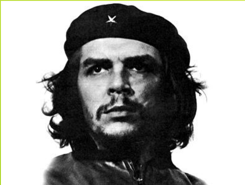
Лидер кубинских революционеров Эрнесто Чегеваро

С начала минувшего века Куба неукоснительно следовала политике США и принимала оттуда массу туристов. Но в 60-е гг. 20 века, после произошедшей в стране революции, правительство США прекратило отношения с новым правительством Кубы; поток туристов иссяк, прибыль от них сократилась.