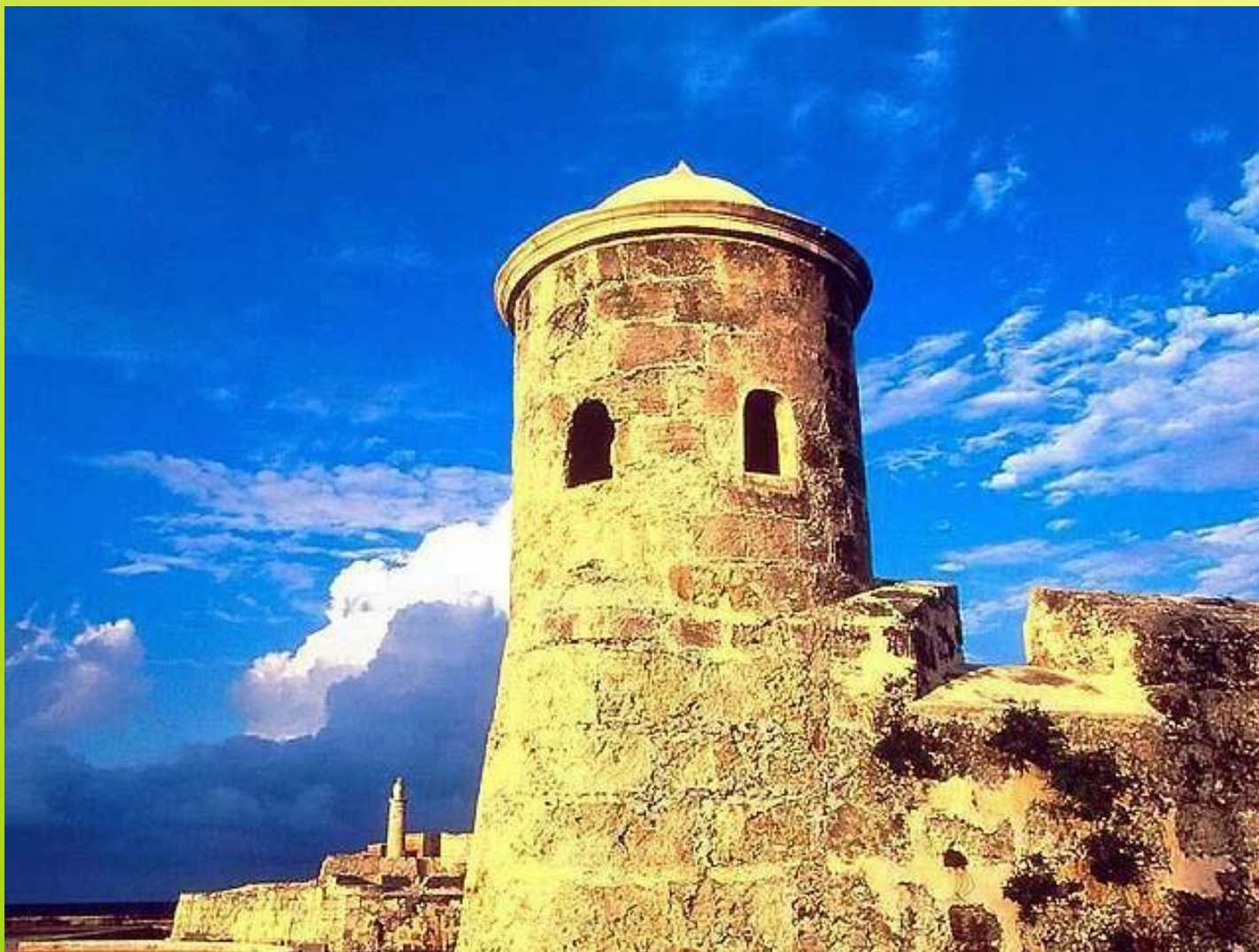
Гавана. Ла Пунта.