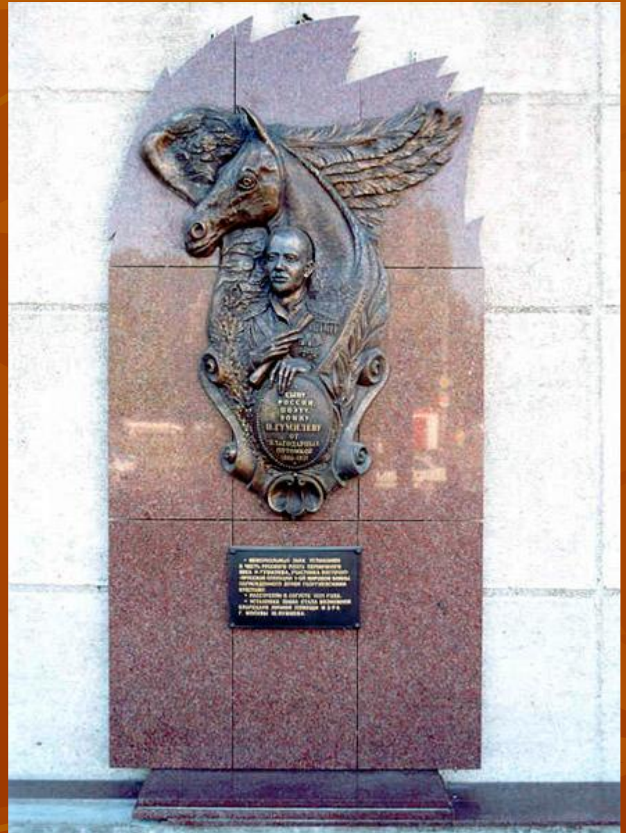
Мемориальная доска в Калининграде

В августе 1921 года Гумилев был расстрелян как участник контрреволюционного заговора.