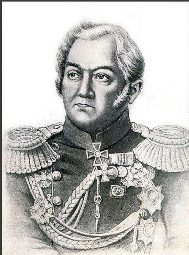
Михаил Петрович Лазарев