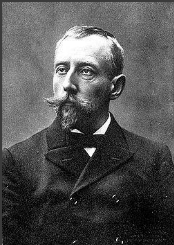
14 декабря 1911 г. Руаль Амундсен