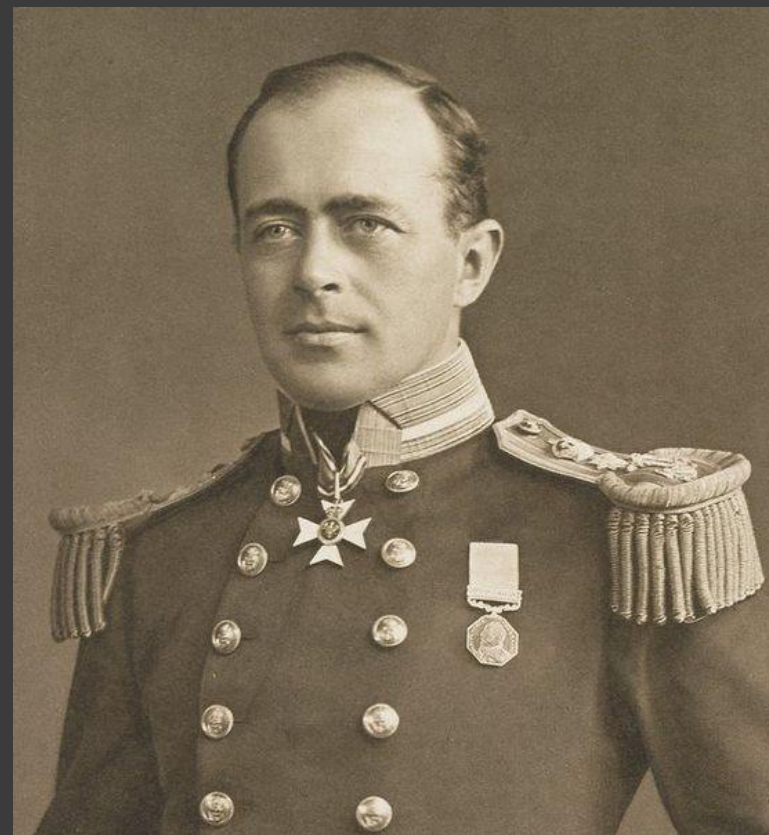
18 января 1912 г. Роберт Скотт