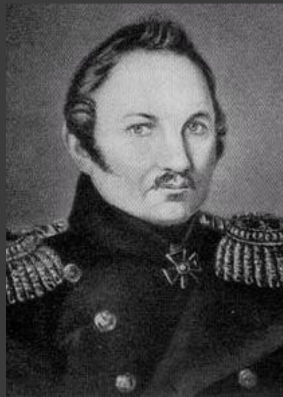
Фаддей Фаддеевич Беллинзгаузен