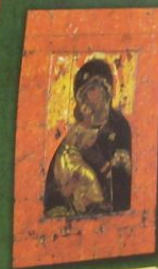
Владимирская икона Пресвятой Богородицы

Согласно преданию, икона написана святым евангелистом Лукой на доске сплывающей с горы Сион. Икона была принесена в Киев в 988 году. В 1015 году икона была перенесена в Новгород, а в 1155 году — в Владимир. Икона была чудотворной, помогая в борьбе с врагами. Празднование иконе — 8 сентября и 3 июня.