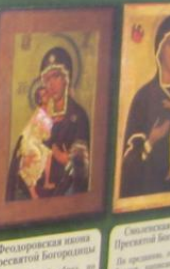
Феодоровская икона Пресвятой Богородицы

Начало иконы берет от иконы города Казани, где она чудотворно явилась в мир после пожара в 1579 году. Согласно преданию, Пресвятая Богородица явилась во сне землетрясительнице Марии и указала, где находится Ее образ. Икона была довершена о сущности иконописца довершено на месте явления иконы, царя Иван Грозный повелел строить на месте явления иконы величественное святилище, в котором воссозданы списки с ней размножились по всей России. Празднование иконе — 21 июля и 4 ноября.