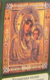
Казанская икона Пресвятой Богородицы

Согласно преданию, икона написана святым евангелистом Лукой на доске сплывающей с горы Сион. Икона была принесена в Киев в 988 году. В 1015 году икона была перенесена в Новгород, а в 1155 году — в Владимир. Икона была чудотворной, помогая в борьбе с врагами. Празднование иконе — 8 сентября и 3 июня.