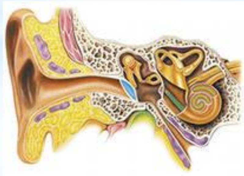
Внутреннее строение уха человека