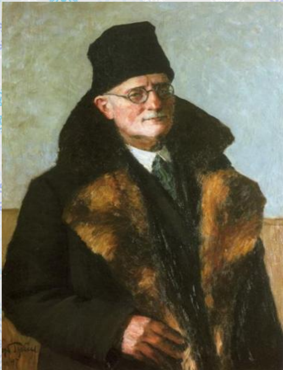
Игорь Эммануилович Грабарь (1861 – 1960)