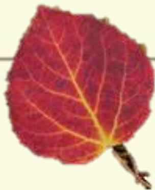
Лист осины (фонарик)