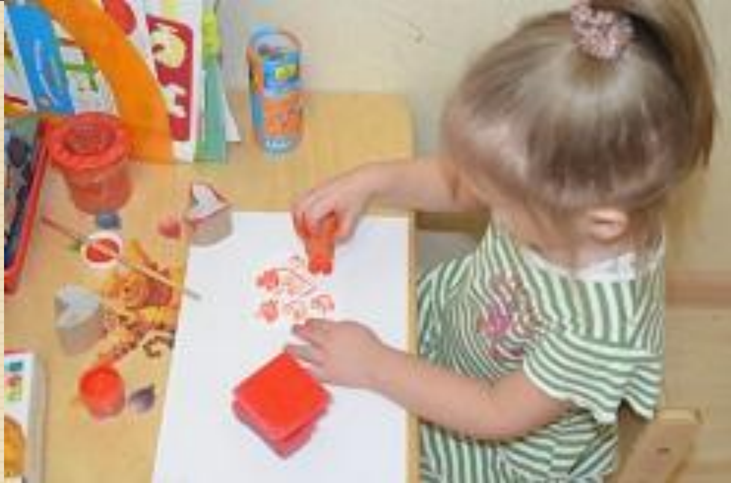
Рисунок печатаем произвольно.