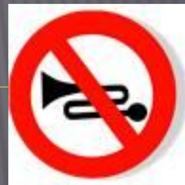
Подача звукового сигнала запрещена