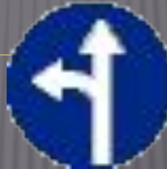
Движение прямо или налево