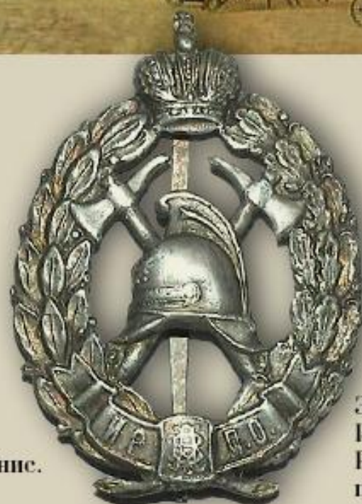
Знак Императорского Российского пожарного общества