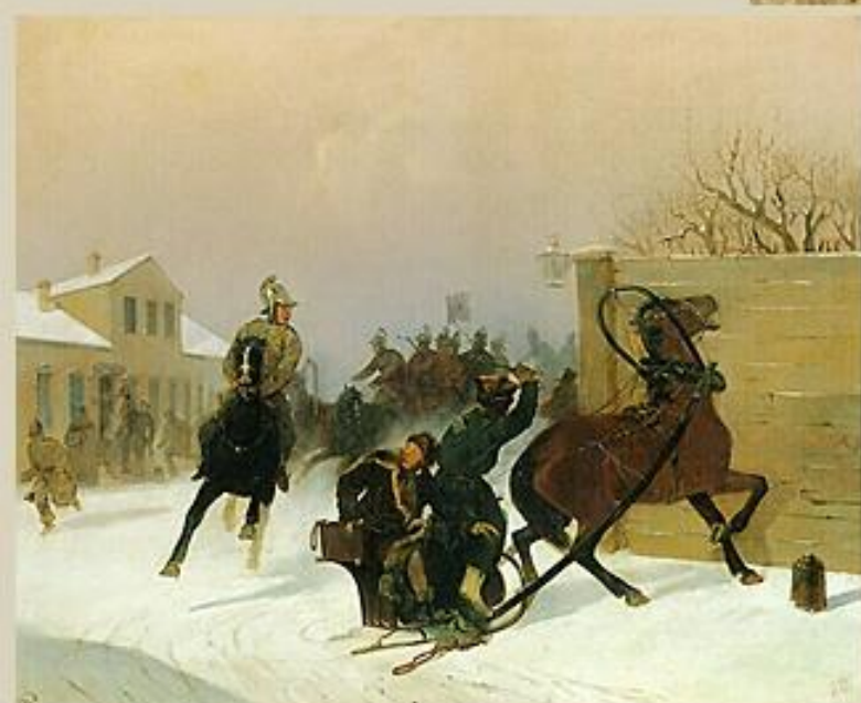
Выезд пожарной команды Г.С. Дестуниса. 1858 г.