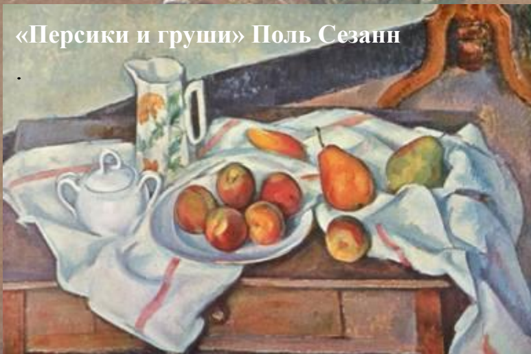
«Персики и груши» Поль Сезанн

неодушевлённые предметы в натюрморте изображают и объекты живой природы, изолированные от естественных связей и тем самым обращённые в вещь – рыбу на столе, цветы в букете, плоды в блюде и т.д.