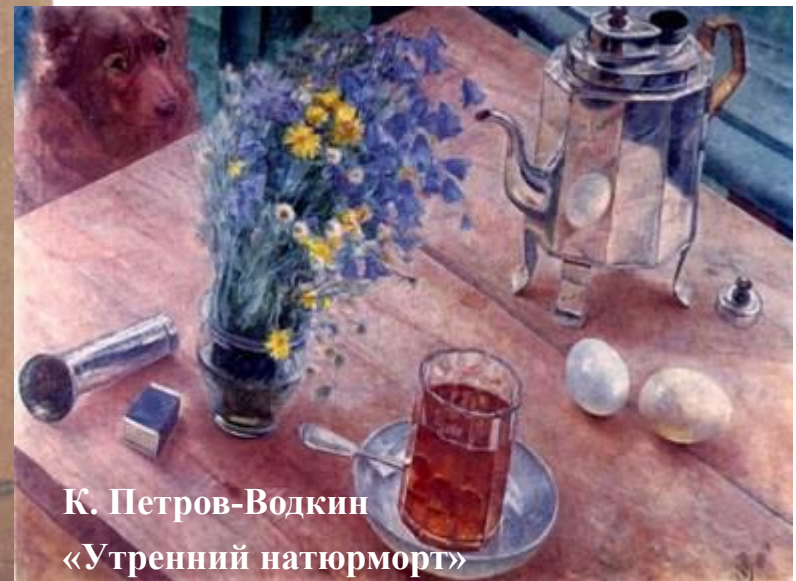
К. Петров-Водкин «Утренний натюрморт»