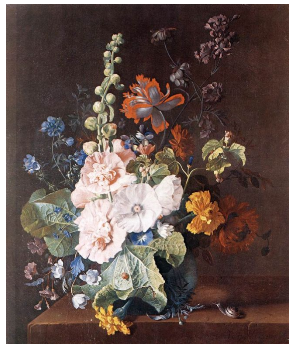
Яна ван Хейсум «Цветы».

Вещи говорят не о самих себе, а о своём хозяине.