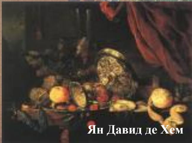
Ян Давид де Хем