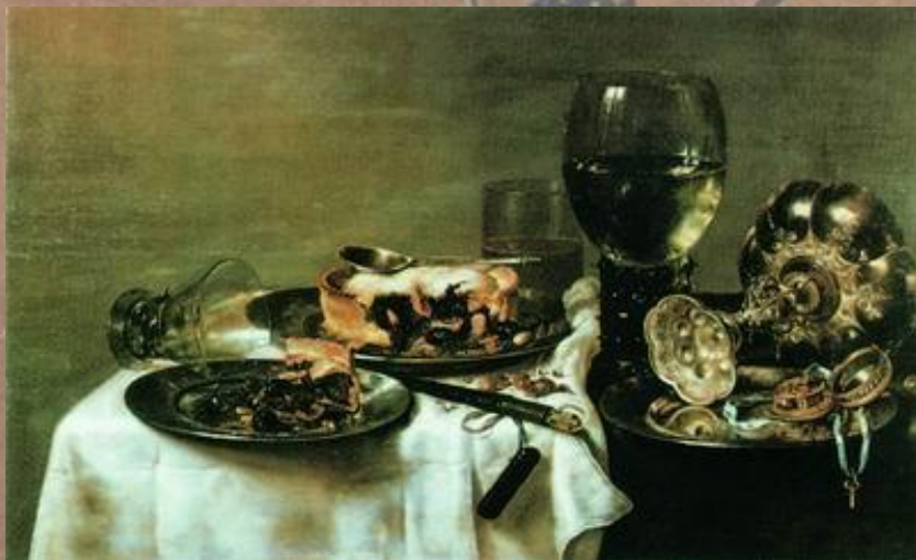
Виллем Клас Хеда «Завтрак с ежевичным пирогом»