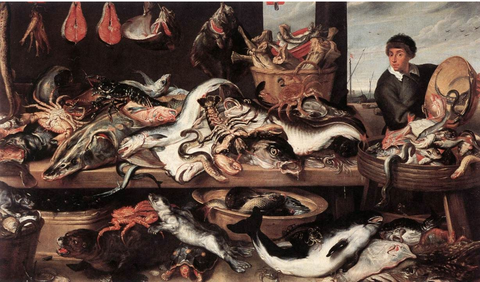
«Рыбная лавка» Франс Снейдерс