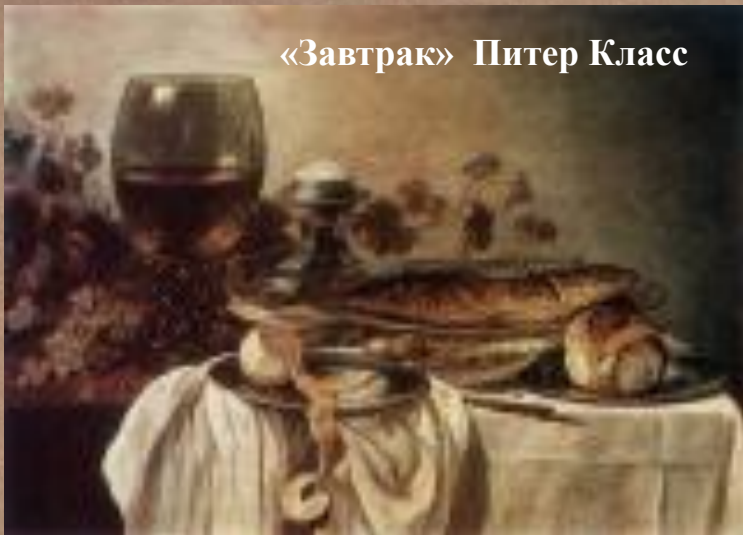
«Завтрак» Питер Класс