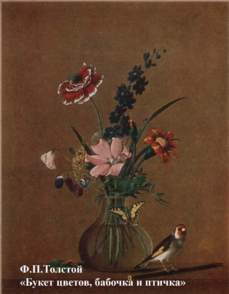
Ф.П.Толстой «Букет цветов, бабочка и птичка»

Дополняя основной мотив, в натюрморт может входить изображение людей, животных, птиц, насекомых.