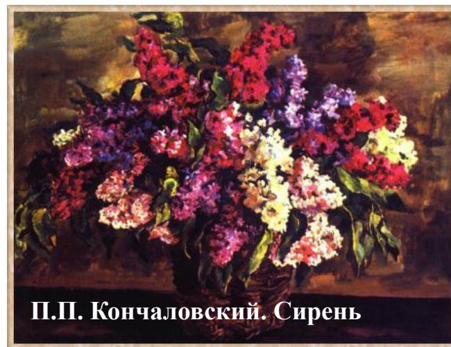
П.П. Кончаловский. Сирень