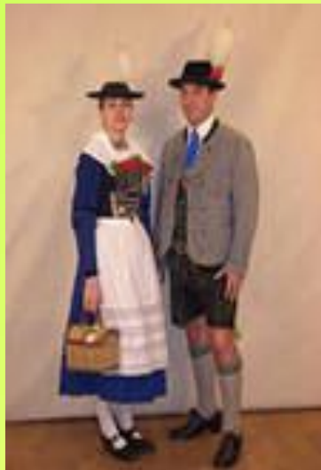
БАВАР МИЛЛИ КИЕМЕ