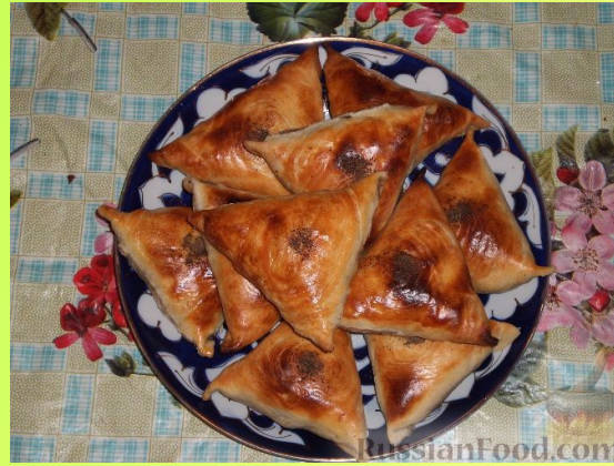
САМСА - ҮЗБӘК МИЛЛИ АШЫ