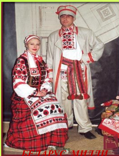
БЕЛАРУС МИЛЛИ КИЕМЕ