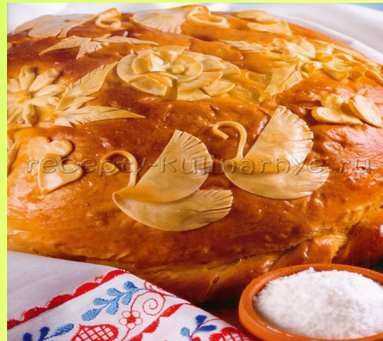
КУРНИК - РУС МИЛЛИ АШЫ