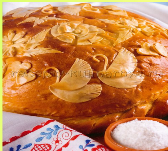
КУРНИК - РУС МИЛЛИ АШЫ