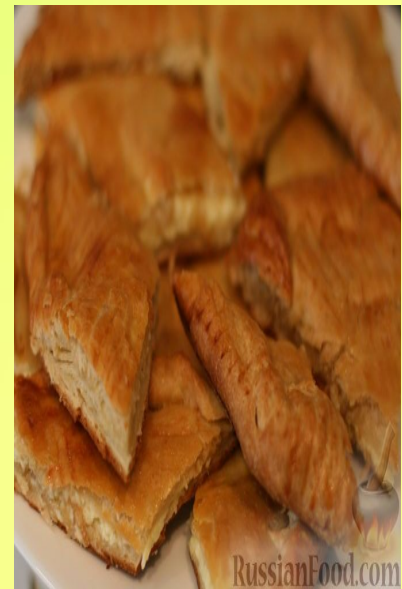
ХАЧАПУРИ - ГРУЗИН МИЛЛИ АШЫ