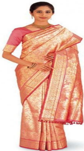
ИНДИЯ МИЛЛИ КИЕМЕ