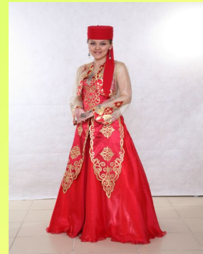
КАЗАК МИЛЛИ КИЕМЕ