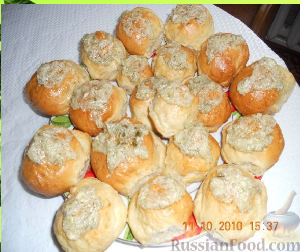
ПАМПУШКИ - УКРАИН МИЛЛИ АШЫ