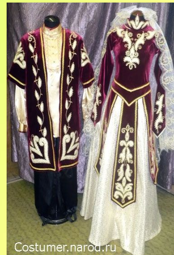
КАВКАЗ МИЛЛИ КИЕМЕ