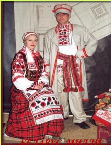
БЕЛАРУС МИЛЛИ КИЕМЕ