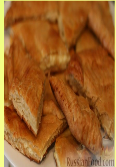
ХАЧАПУРИ - ГРУЗИН МИЛЛИ АШЫ