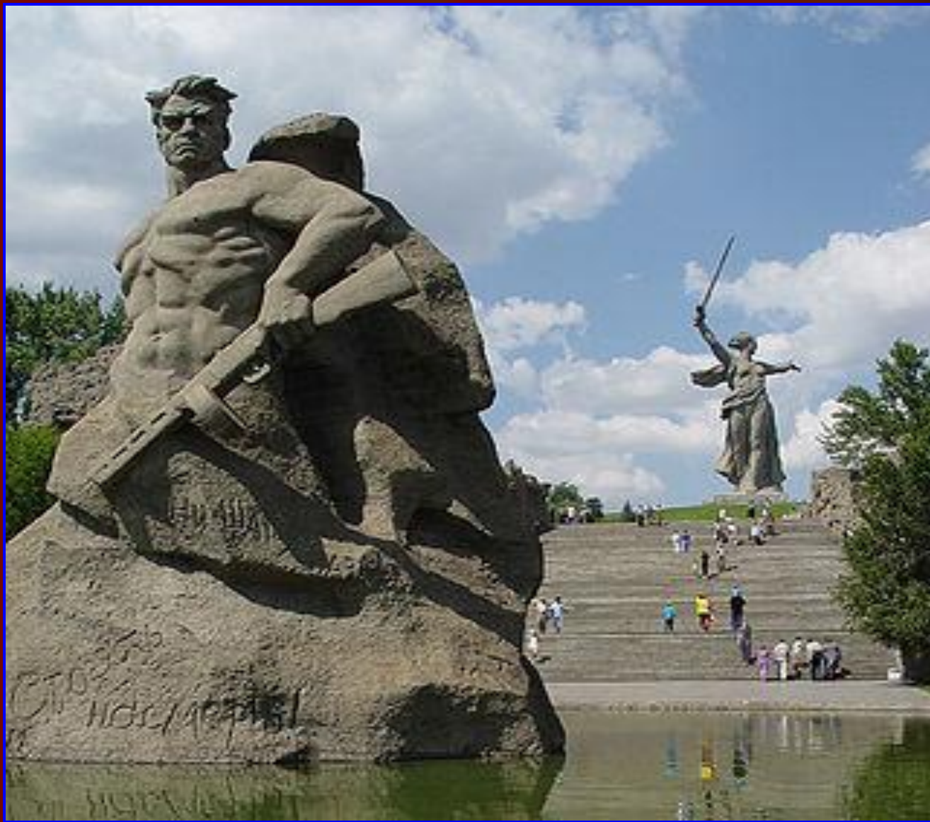
Мамаев курган. Волгоград.