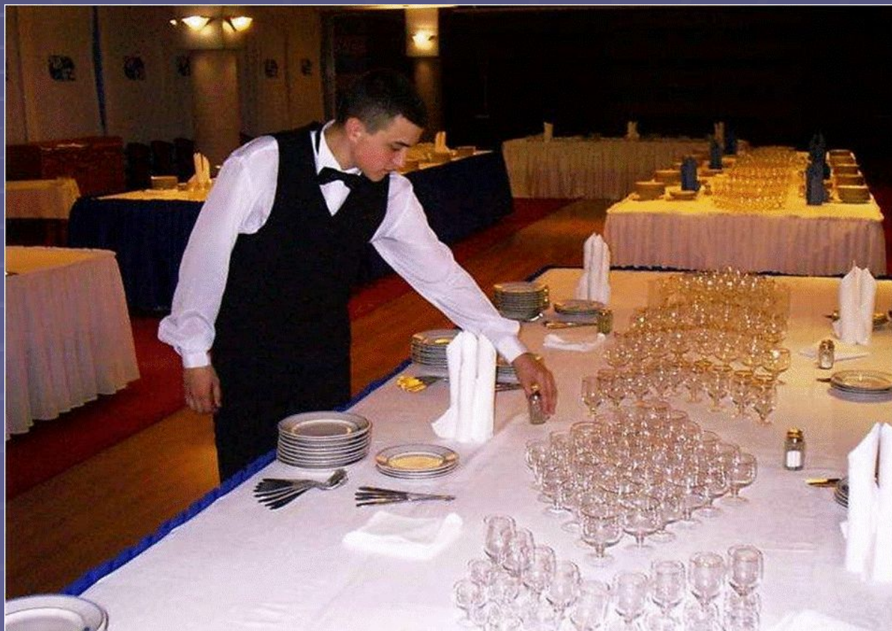
Сервировка банкетного стола