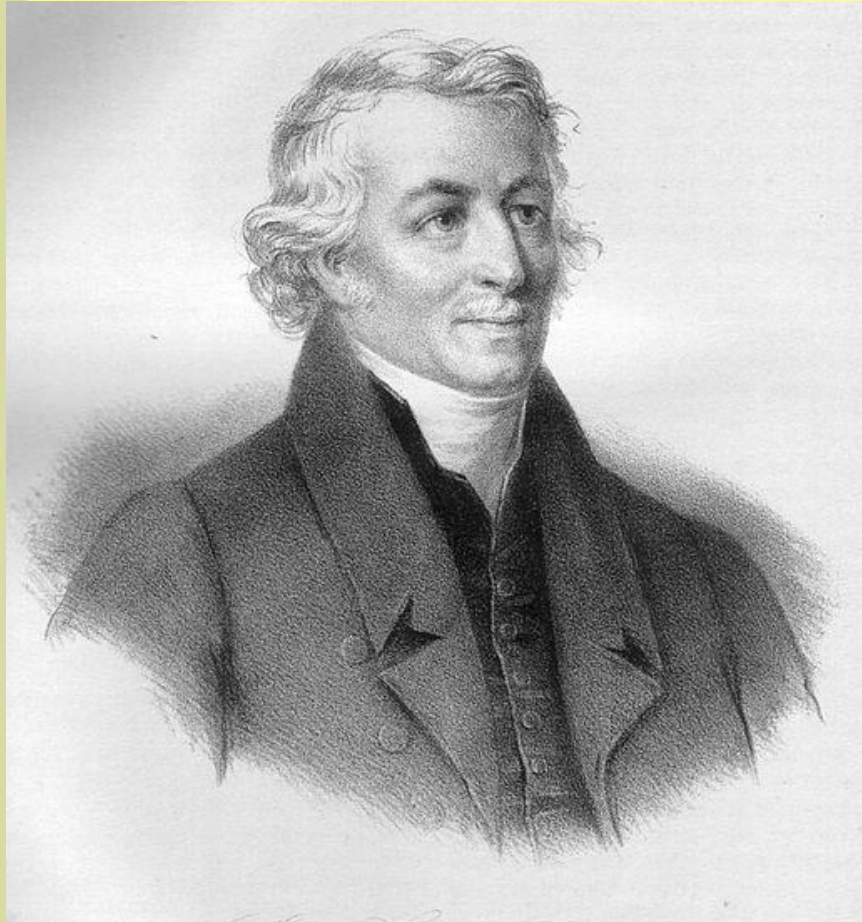
Фредерик Сезар Лагарп, воспитатель Александра I

Значительное влияние на будущего императора оказал один из его воспитателей, швейцарский политик Ф. С. Лагарп, приверженец идей либерализма. Он пытался внести эти идеи в сознание Александра.