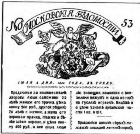
Объявление в газете о продаже крепостных

Одним из самых важных решений Александра стал указ от 20 февраля 1803 г. о «вольных хлебопашцах» , по которому помещики могли отпускать своих крепостных на волю с земельными наделами за выкуп. Это был первый в истории России закон, дававший возможность освобождения крестьян от крепостной зависимости