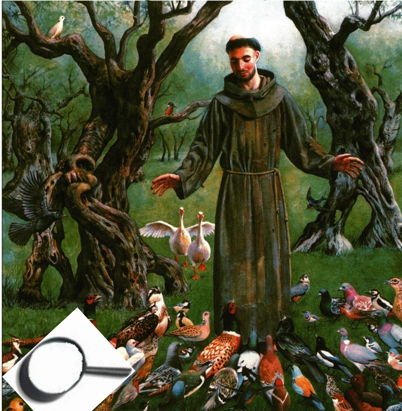
Деннис НОЛАН. Святой Франциск беседует с птицами. 2005 г.