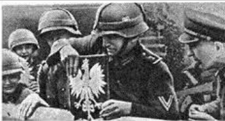
Фашисты уничтожают пограничный знак Польши

Уже 28 сентября немцы занимают Варшаву. На захват Польши ушло 27 дней.