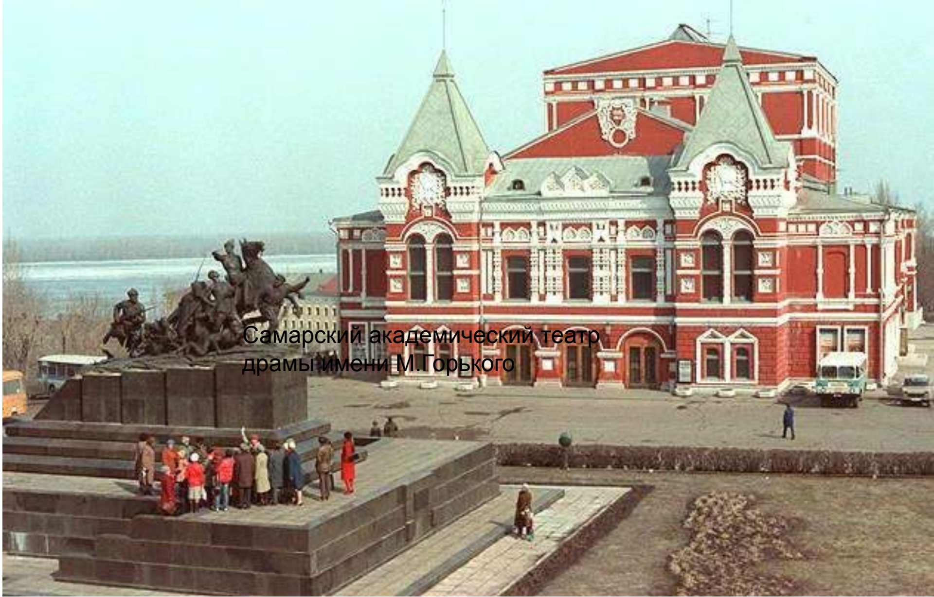
Самарский академический театр драмы имени М.Горького

Самарский академический театр имени М. Горького